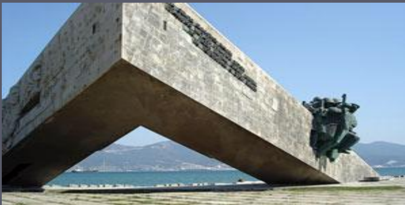
Мемориальный комплекс «Малая земля»

Отбитый у фашистов небольшой кусочек Новороссийской земли — меньше 30 квадратных метров — назвали Малой землей.