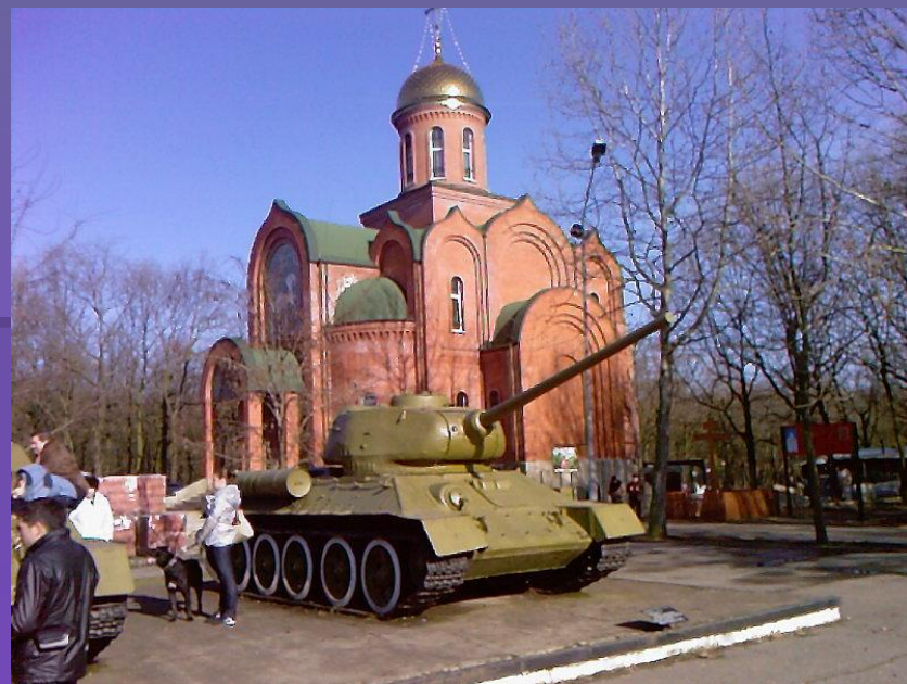
Мемориал героической обороны Одессы 411-й береговой батареи