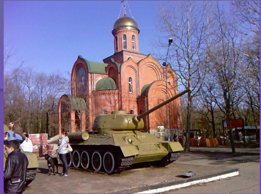
Мемориал героической обороны Одессы 411-й береговой батарее