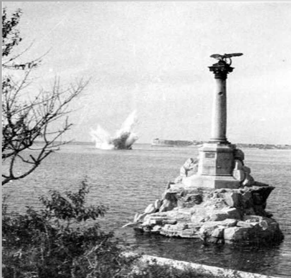
Взрыв немецкой мины на центральном рейде, 1941 год.

После провала попытки овладеть Севастополем с ходу немецко- фашистское командование осуществило три наступления на город: первое началось 11 ноября 1941 г., второе - 17 декабря 1941 г., третье - 7 июня 1942 г.