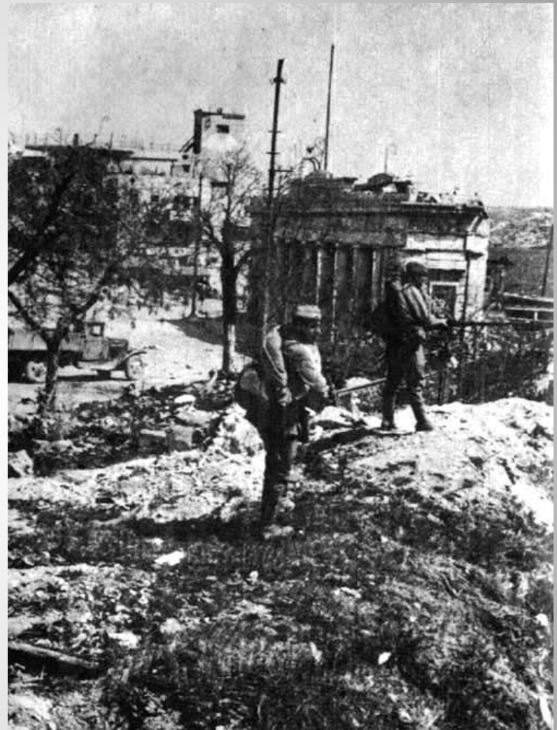
В городе тишина. Севастополь, 1944 год

Несмотря на жесточайший оккупационный режим, севастопольцы не прекратили борьбу с фашистами.