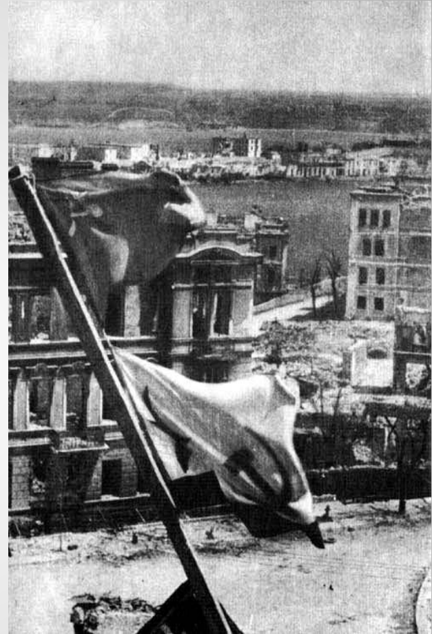
Над руинами города взвились Красные флаги победы. Севастополь, 1944 год

9 мая к вечеру был полностью освобожден Севастополь, 10 мая в час ночи Москва 24 залпами из 342 орудий салютовала освободителям города. В этот день газета "Правда" писала: "Здравствуй, родной Севастополь! Любимый город советского народа, город-герой, город-богатырь! Радостно приветствует тебя вся страна!". 12 мая в районе мыса Херсонес были разгромлены остатки фашистских войск в Крыму.