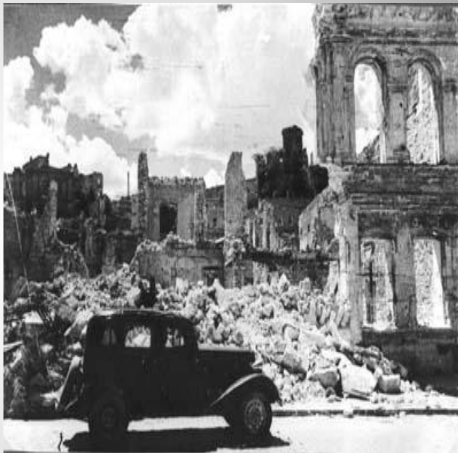
В разрушенном Севастополе 1944 года.

Защитников города постоянно поддерживали корабли флота. Прорываясь в осажденный Севастополь, они доставляли пополнения, боеприпасы, продукты питания, увозили на Большую землю раненых, стариков, женщин и детей, вели артиллерийский огонь по позициям врага. А когда надводные корабли уже не могли прорываться к Севастополю, их задачу отважно выполняли экипажи подводных лодок. Несгибаемое мужество и само отверженность проявили в дни обороны медицинские работники флота и города. За 8 месяцев обороны они спасли жизни десяткам тысяч людей, возвратили в строй 30927 раненых и 10686 больных.