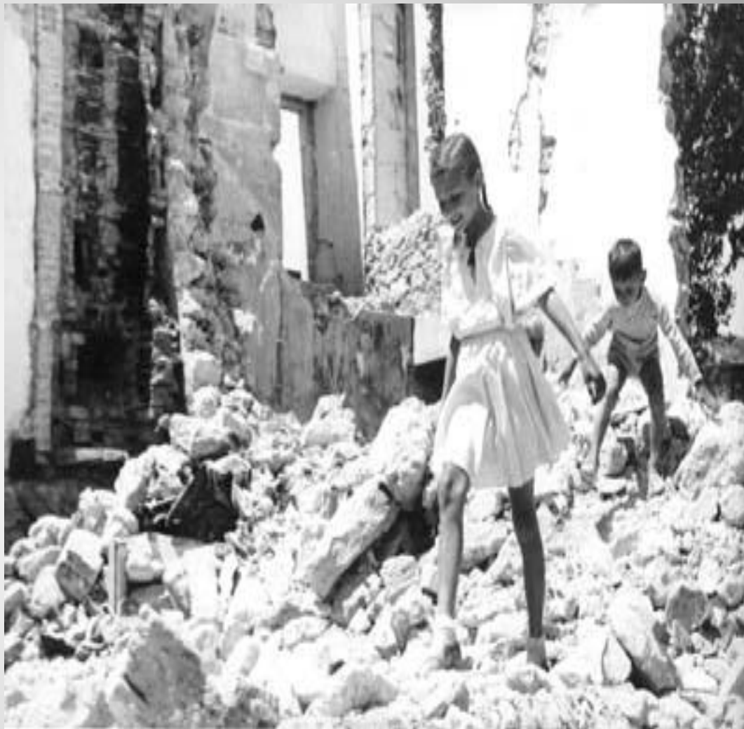
Весна 1942 года в Севастополе

В ознаменование подвига защитников города 22 декабря 1942 г. Указом Президиума Верховного Совета СССР была учреждена медаль "За оборону Севастополя", которой награждено свыше 50 тыс. участников обороны.