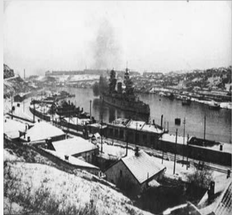
Линкор "Севастополь" ведет огонь по позициям врага из Южной бухты. 29 декабря 1941 года.