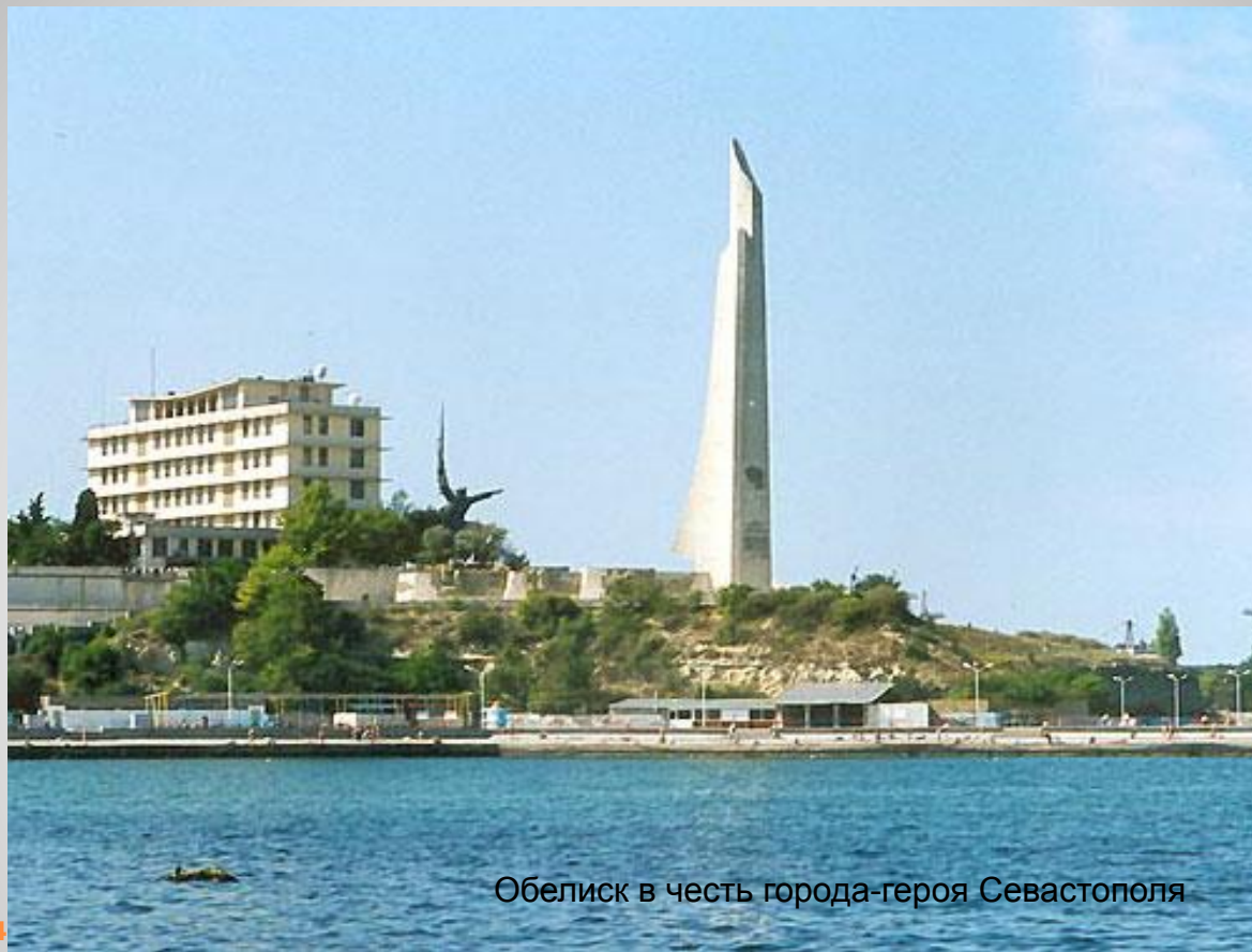
Обелиск в честь города-героя Севастополя