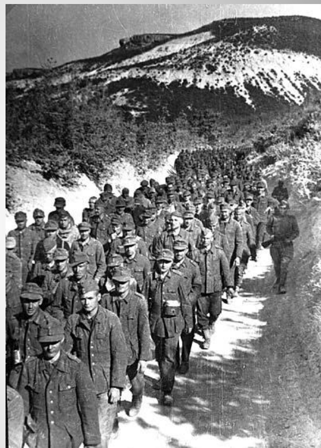
IX в районе Мекензиевых гор под Севастополем.

4 июля 1942 г. газета "Правда" и Совинформбюро сообщили, что советские войска оставили Севастополь. В сообщении Совинформбюро говорилось: "Военное и политическое значение Севастопольской обороны в Отечественной войне советского народа огромно. Сковывая большое количество немецко-румынских войск, защитники города спутали и расстроили планы немецкого командования. Железная стойкость севастопольцев явилась одной из важнейших причин, сорвавших пресловутое "весеннее наступление" немцев. Гитлеровцы проиграли во времени, в темпах, понесли огромные потери людьми." За 8 месяцев обороны враг потерял у стен Севастополя до 300 тыс. солдат убитыми и ранеными. Газета "Правда" писала: "Подвиг севастопольцев, их беззаветное мужество, самоотверженность, ярость в борьбе с врагом будут жить в веках, их увенчает бессмертная слава".