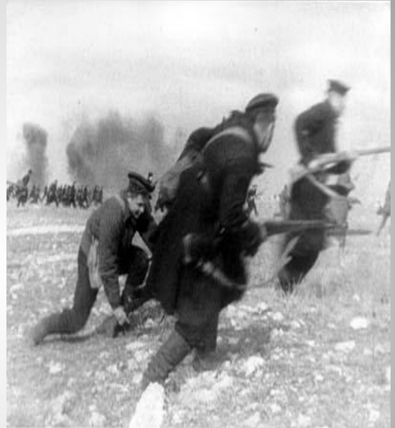
Морская пехота в атаке. 1942 год. Кадр из фильма "Севастопольцы"

Моряки Черноморского флота, жители города организованно встали на защиту Севастополя.