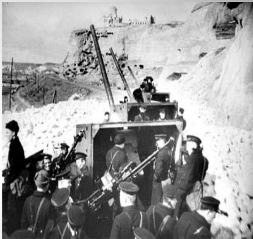
Бронепоезд выходит на позицию. 1942 год

В дни обороны жители города проявили ратный и трудовой героизм. Рабочие Морского завода под обстрелом врага ремонтировали корабли, создавали боевую технику днем и ночью, оборудовали два бронепоезда, построили и оснастили плавучую батарею № 3, получившую название "Не тронь меня", которая надежно прикрывала город от налетов фашистской авиации с моря. Немцы называли ее "Квадрат смерти". В горных выработках (штольнях) на берегу Севастопольской бухты были созданы подземные спецкомбинаты; № 1 - для производства вооружения и боеприпасов, № 2 - по пошиву белья, обуви и обмундирования. Тут же, под землей, работали амбулатории, столовая, клуб, школа, детские ясли и сад, а впоследствии - госпиталь, хлебозавод.