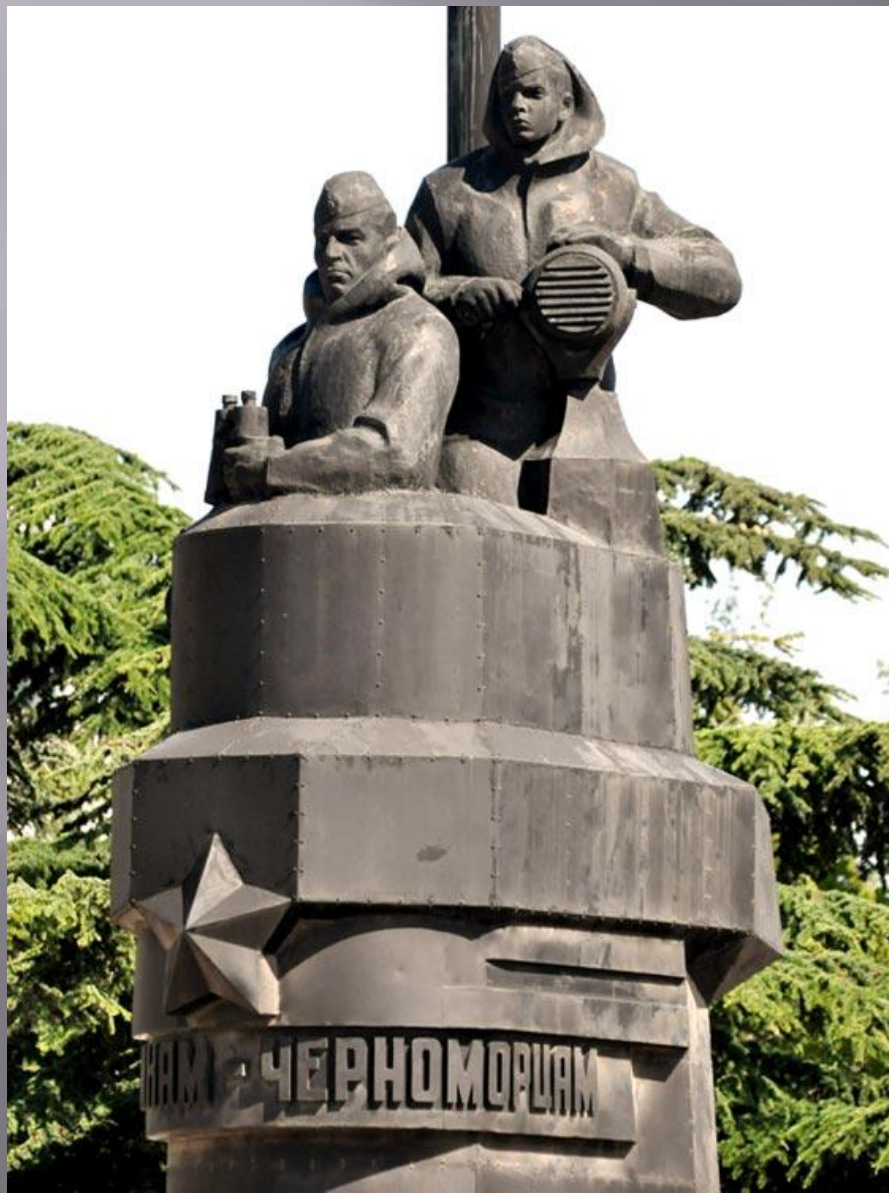
Памятник затопленным кораблям – символ города