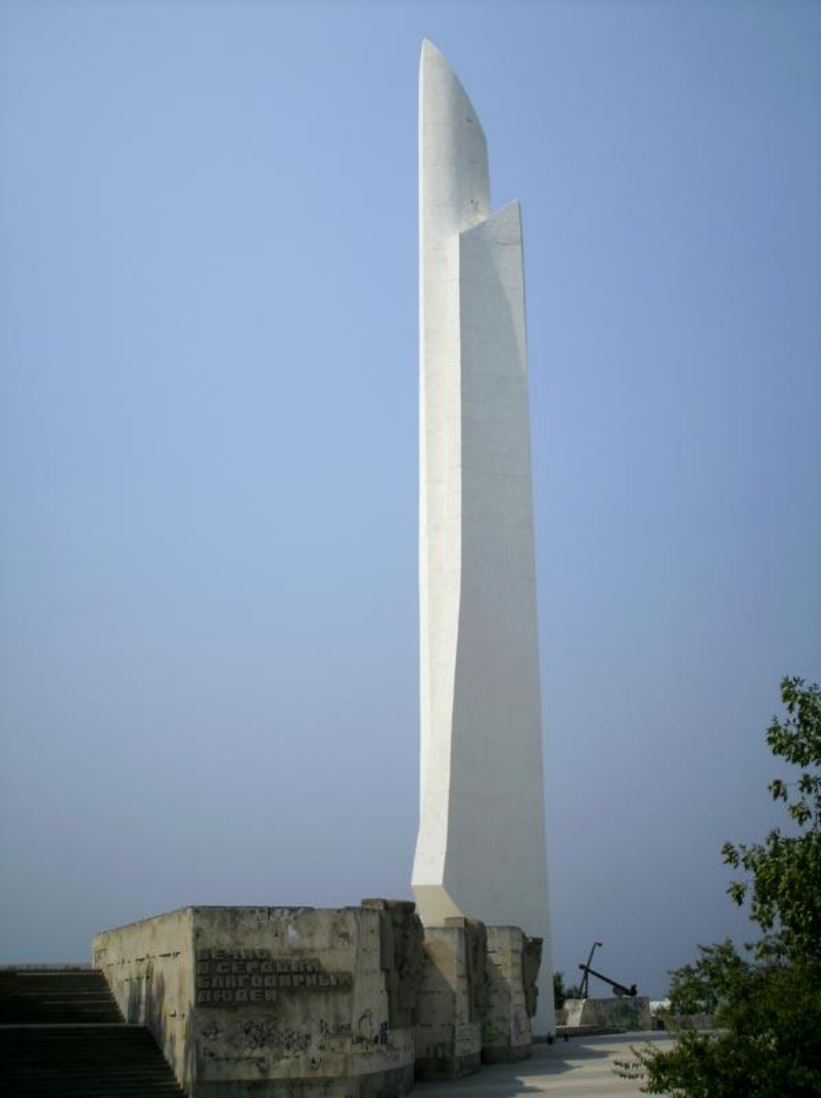
Обелиск «Штык-парус» в честь присвоения Севастополю звания «Город-герой»