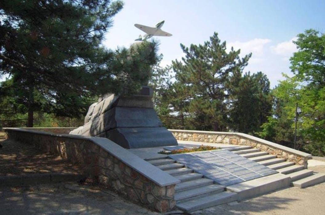
Памятник мужеству авиаторов-черноморцев