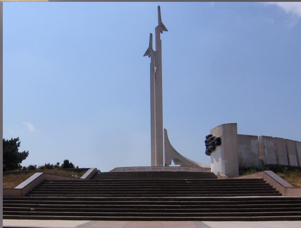
Памятник лётчикам на Малаховом кургане