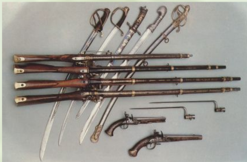
Холодное и огнестрельное оружие (XVIII-XIX века)

С 16 века Тула - кузница русского оружия. С тех самых пор тульские оружейники стали вооружать русскую армию пушками, ружьями.