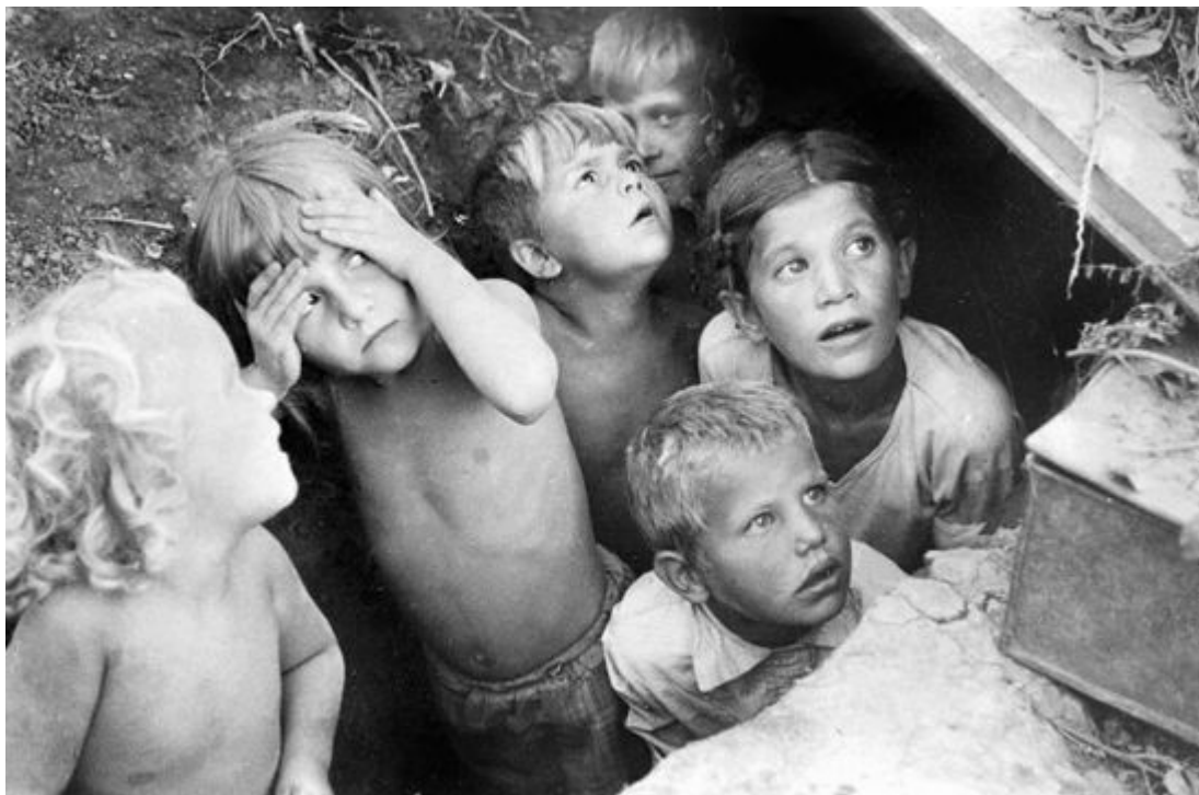
Дети прячутся от бомбежки в щели. 1941 год.

В 4 часа утра 22 июня 1941 года войска фашистской Германии (5,5 миллионов человек) перешли границы Советского Союза, немецкие самолеты (5 тысяч) начали бомбить со города, воинские