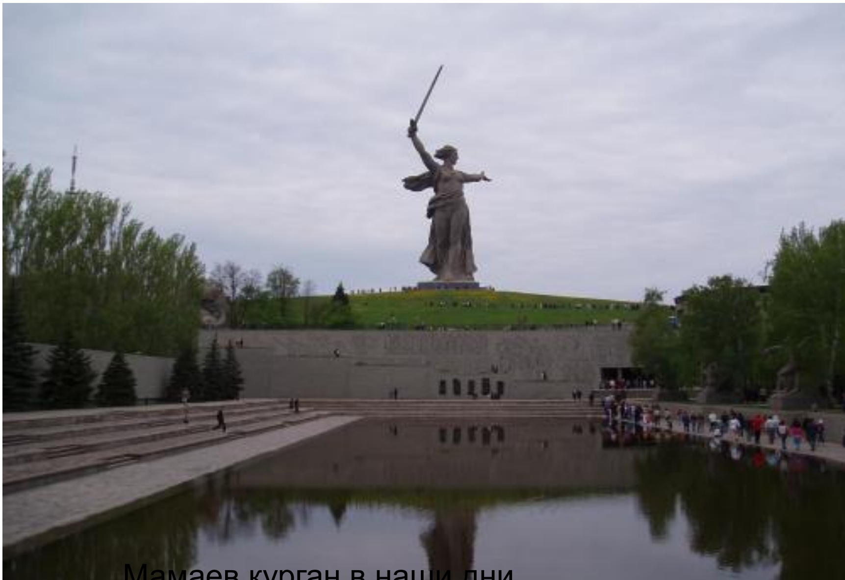
Мамаев курган в наши дни