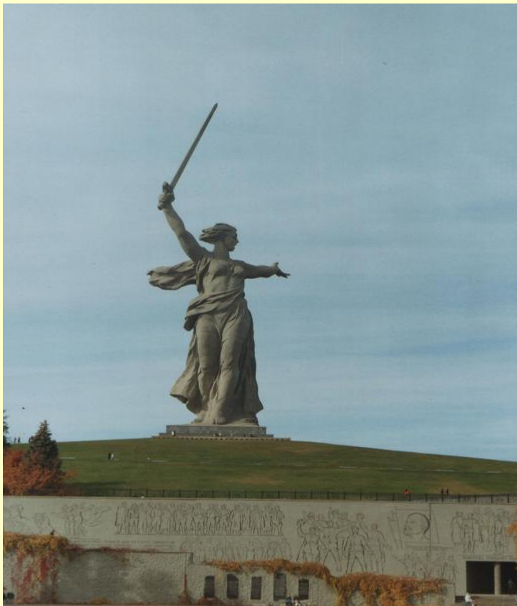
Мамаев курган в наши дни