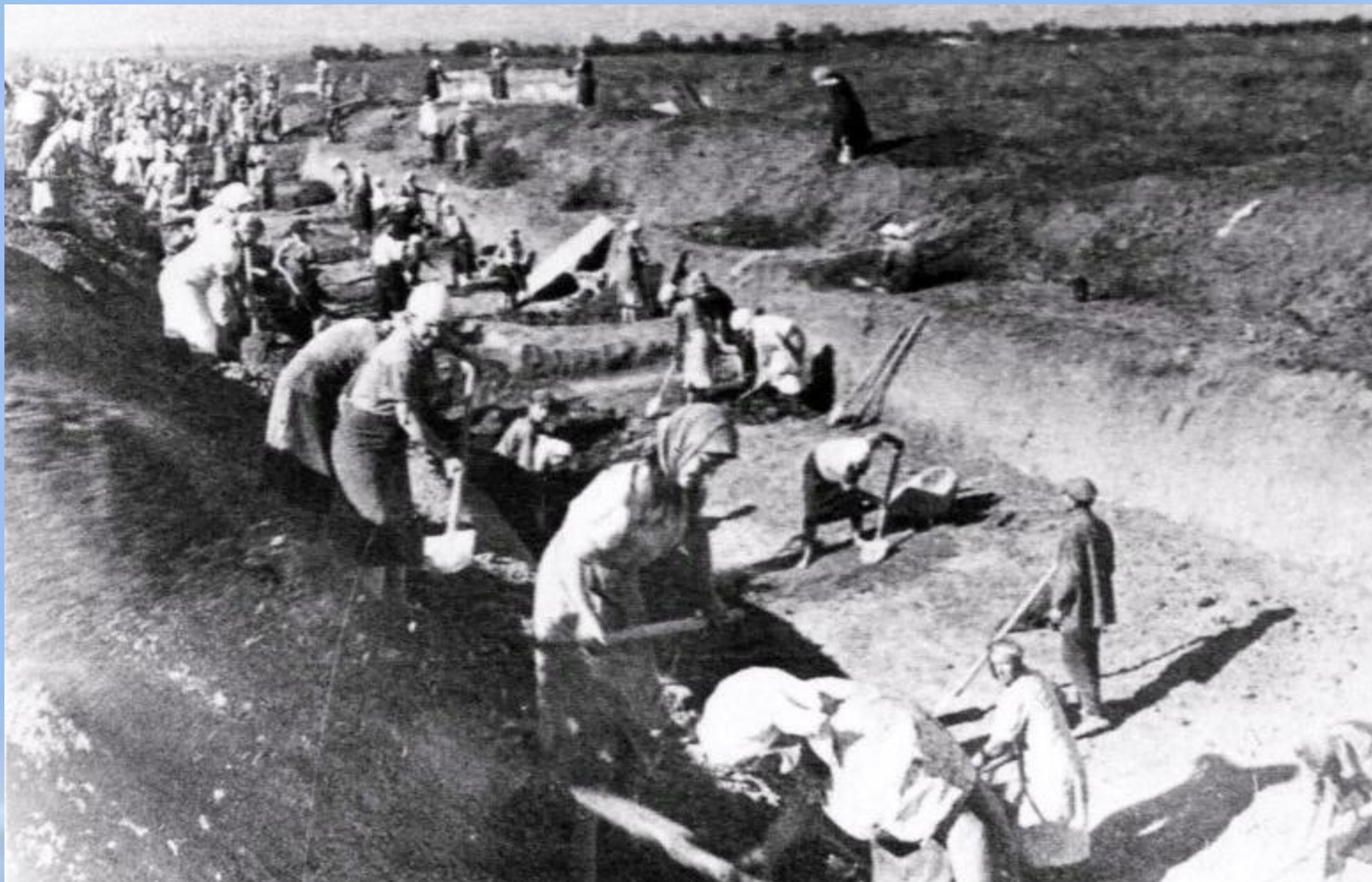
Мирные жители на строительстве противотанковых рвов.