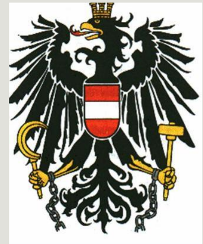
Герб цеха кузнецов