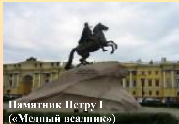
Памятник Петру I («Медный всадник»)