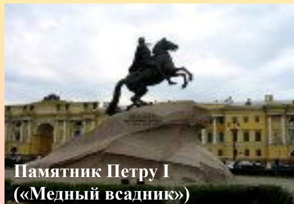
Памятник Петру I («Медный всадник»)