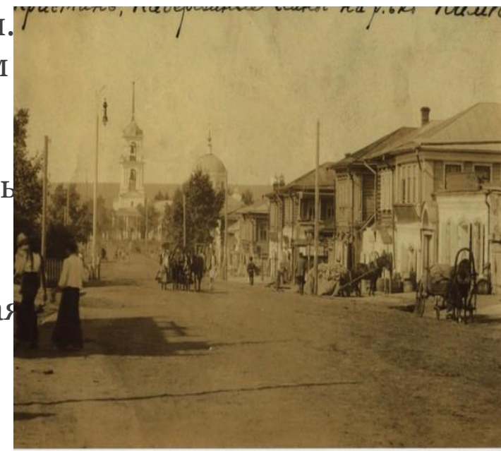
Улица Центральная в XX в.