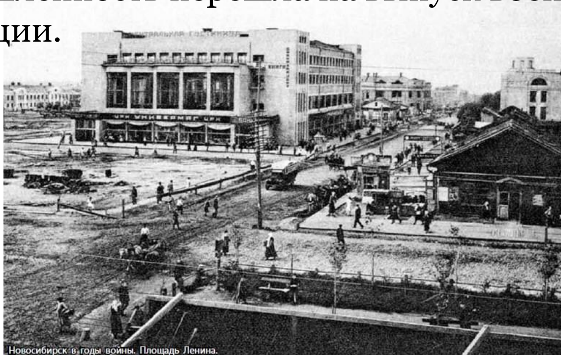
Новосибирск в годы войны. Площадь Ленина.