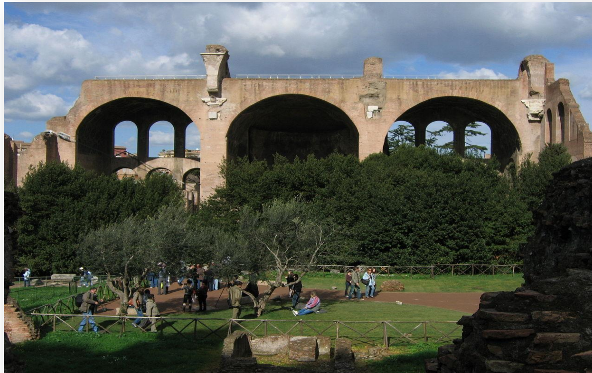
Развалины базилики Максенция в Риме (начало IV века)

Базиликами также именуются наиболее значимые римско-католические храмы вне зависимости от их архитектурного решения. О религиозном значении термина см. базилика (титул).