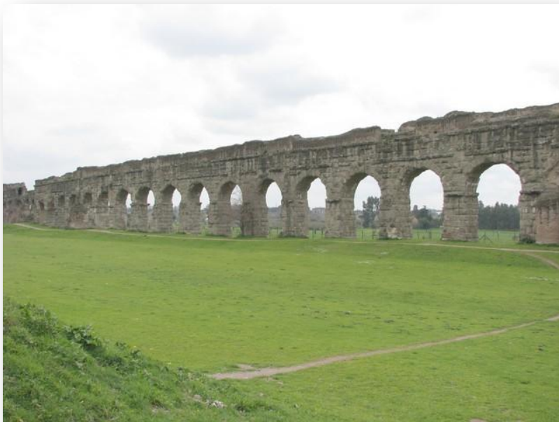
Акведук в Риме IV веке до нашей эры

Аркады применялись при устройстве открытых галерей, идущих вдоль стены здания, например театра, а также в акведуках – многоярусных каменных мостах, внутри которых скрывались свинцовые и глиняные трубы, подающие воду в город. Первый акведук был сооружен в Риме в I в. до н.э. Почти все крупные города римской империи получали техническую и питьевую воду с помощью акведуков.