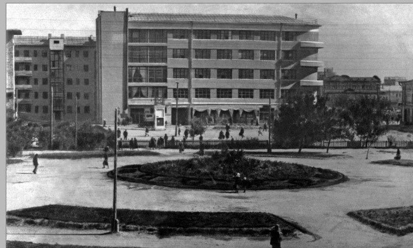
Дом местной промышленности

В 1925 году по решению Центрального Исполнительного Комитета, Царицын был переименован в Сталинград . Документы свидетельствуют, что сам товарищ Сталин был против такого переименования, он даже отказался явиться на местный Съезд Советов. В 1924 году Сталинград указом правительства награжден орденом Красного Знамени . Вплоть до начала Великой Отечественной войны в городе продолжалось активное промышленное и социальное строительство: были пущены в строй тракторный и метизный заводы, началось возведение электростанции, открылся Сталинградский институт. Сталинград превратился в крупнейший