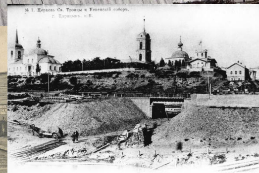
№ 1. Царькоя Св. Троицы и Успенскій соборъ. г. Царицыня. «В».