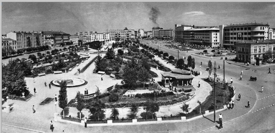
Площадь Павших борцов