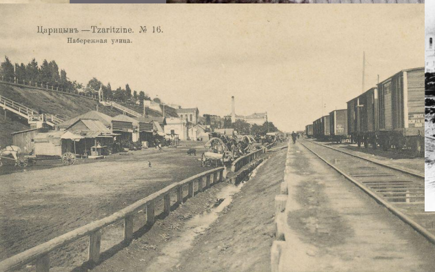
Царицыня. —Tzaritzine. № 16. Набережная улица.