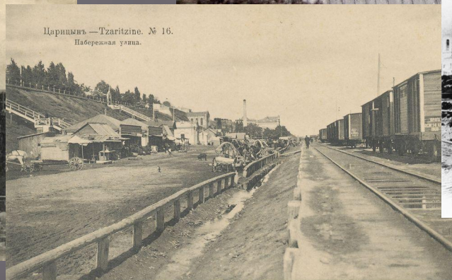
Царицыня. —Tzaritzine. № 16. Набережная улица.