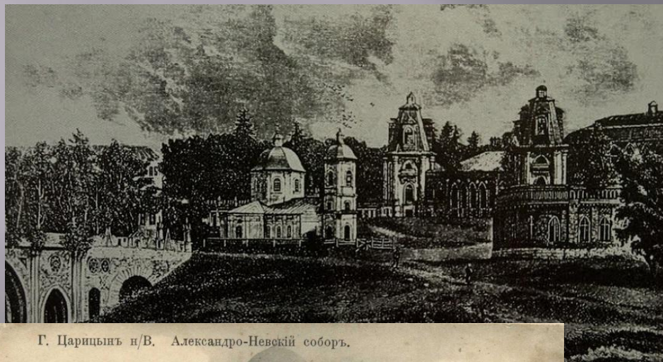
Г. Царицынь н/В. Александро-Невскій соборъ.

В 1808 году в Царицыне была открыта первая в городе школа по обучению детей грамоте. В 1812 году заработал горчичный завод, а в 1820 году по приказу царя Александра I был утвержден новый план застройки Царицына. В 1862 году от Царицына до Калача-на-Дону была проложена Волго-Донская железная дорога. 1814 год положил начало буксирному пароходству, а в 1857 году открылось регулярное пассажирское движение по Волге. В 1872 году в Царицыне был открыт первый театр. В 1885 году вышел первый номер газеты «Волжско-Донской общедоступная библиотека».