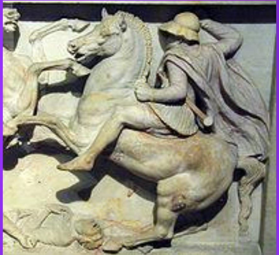
Македонский кавалерист с саркофага Александра Великого (IV в. до н. э.)