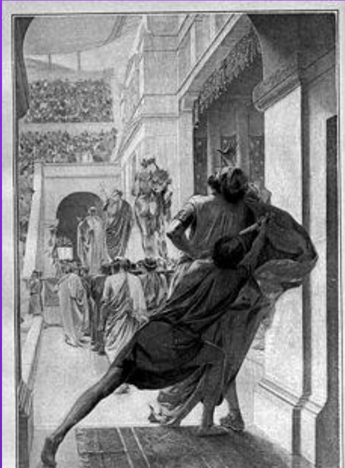
Убийство Филиппа Павсанием