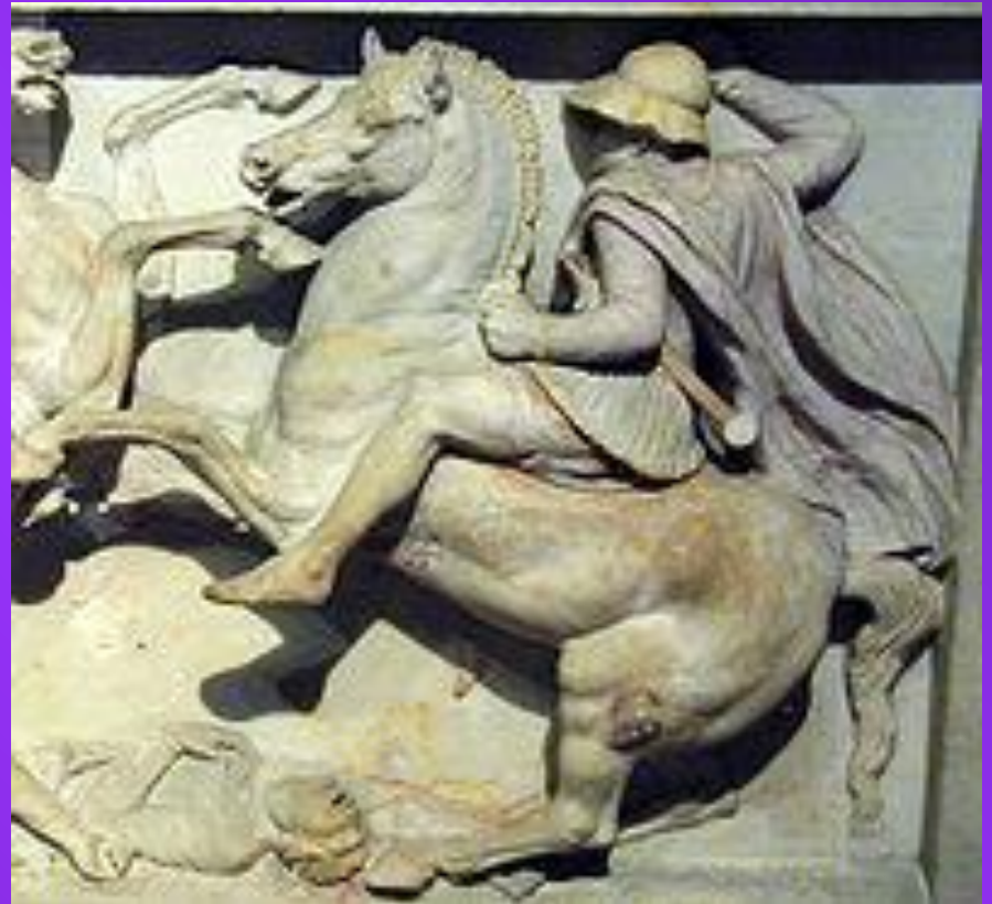
Македонский кавалерист с саркофага Александра Великого (IV в. до н. э.)