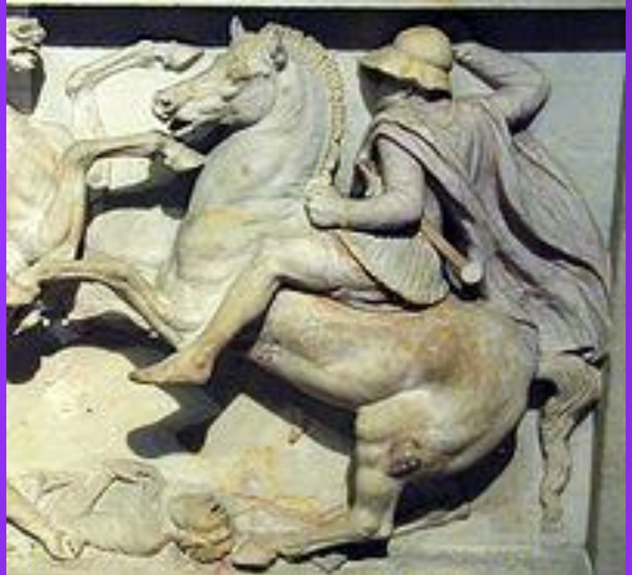
Македонский кавалерист с саркофага Александра Великого (IV в. до н. э.)