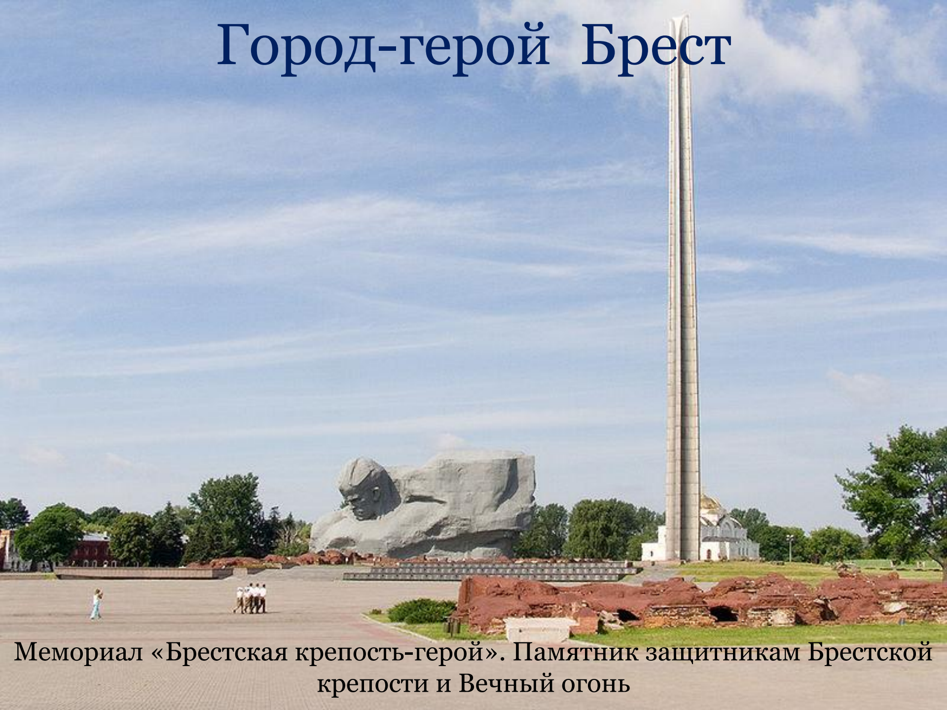
Мемориал «Брестская крепость-герой». Памятник защитникам Брестской крепости и Вечный огонь