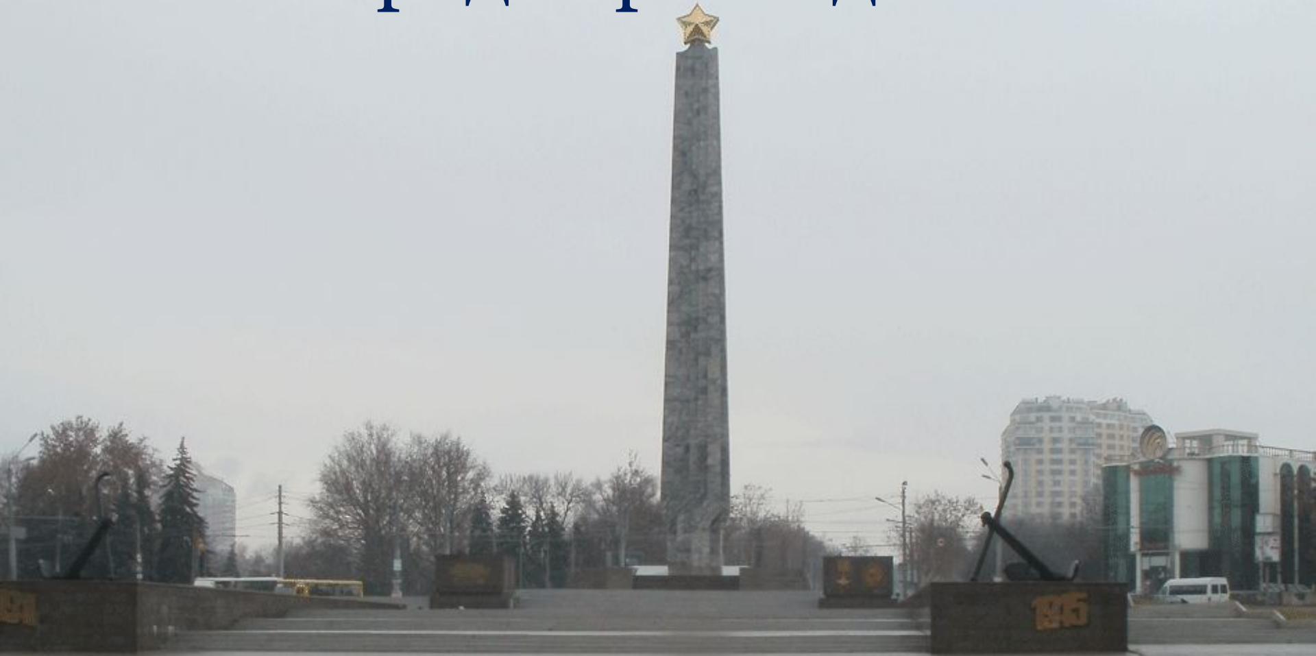
Мемориал «Крылья победы»