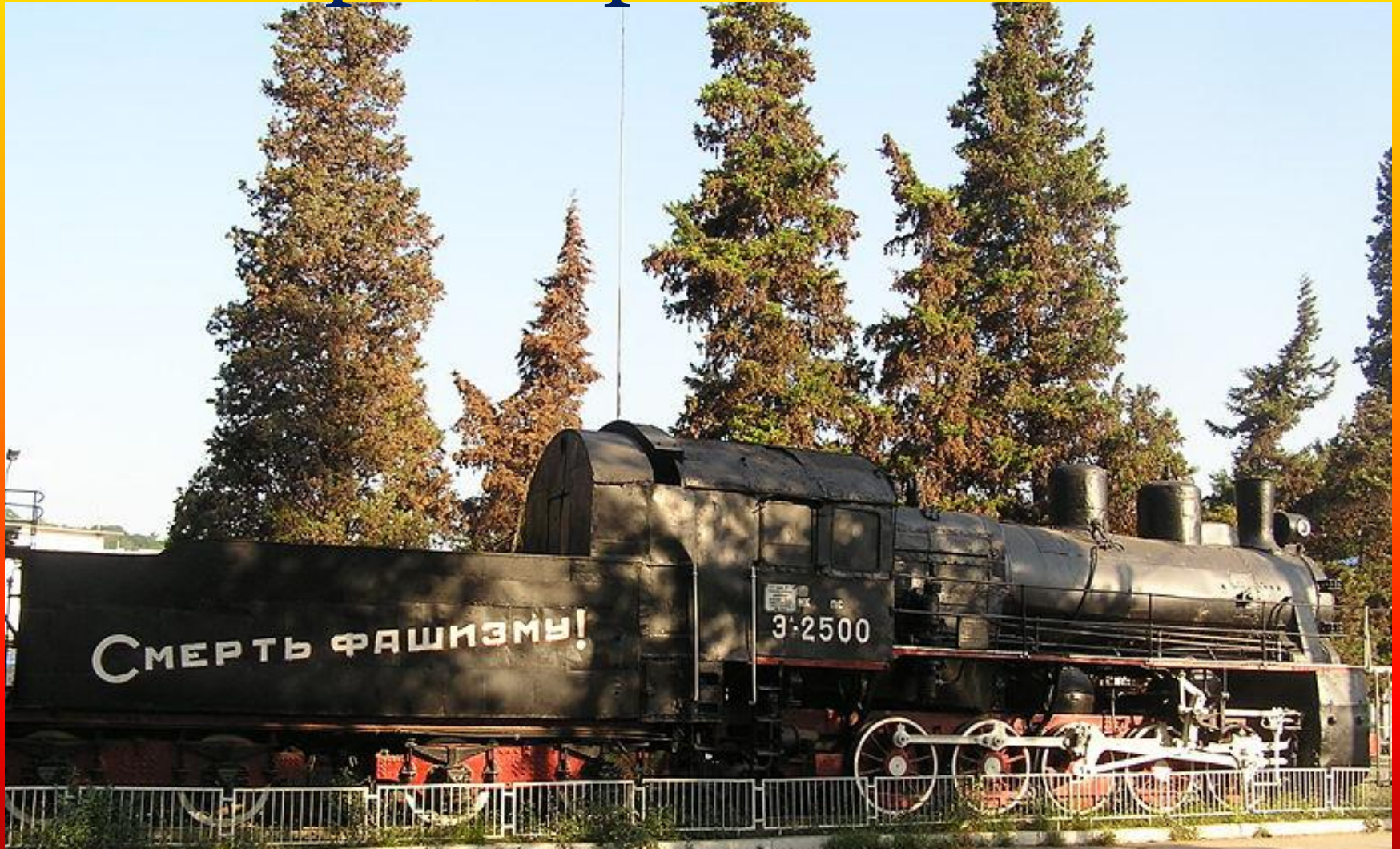
Памятник бронепоезду «Железняков»