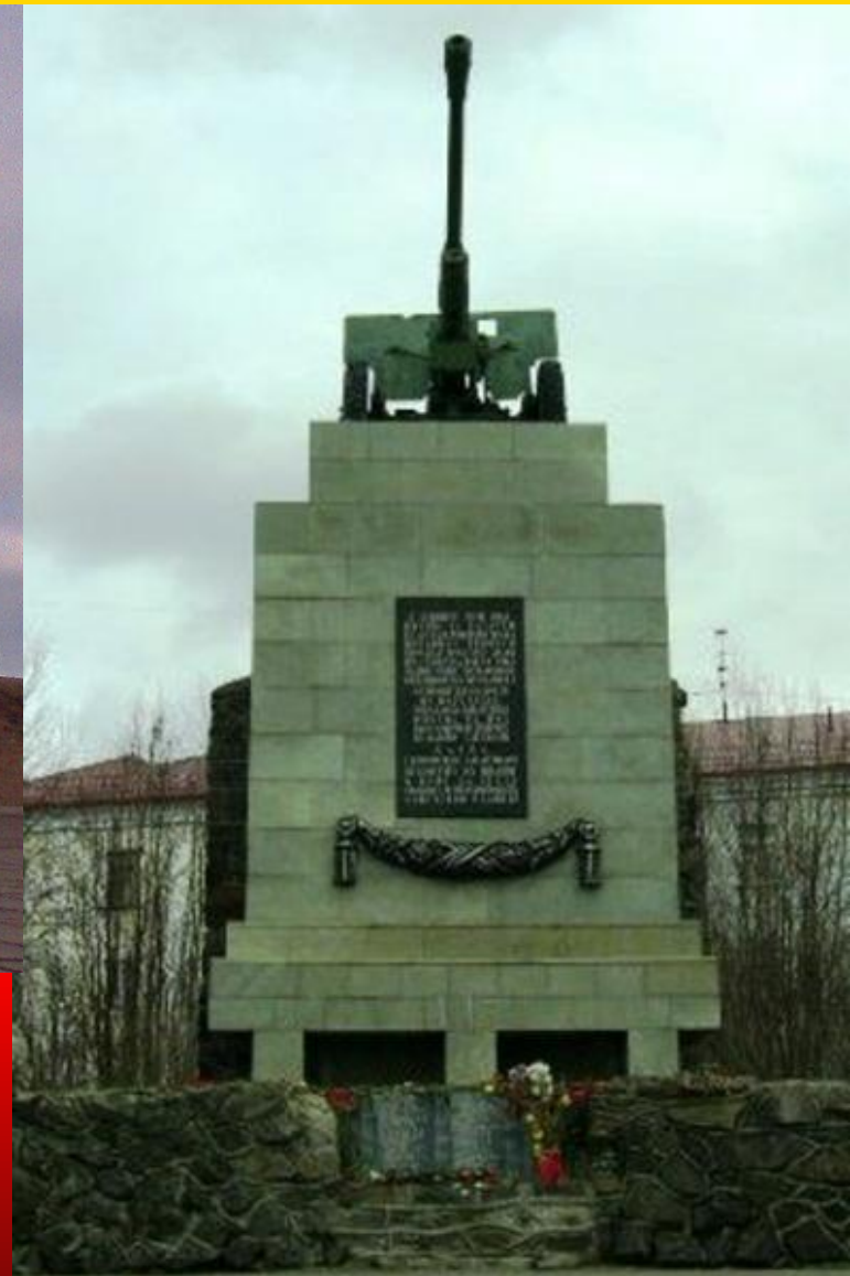
Памятник 6-й гвардейской батареи