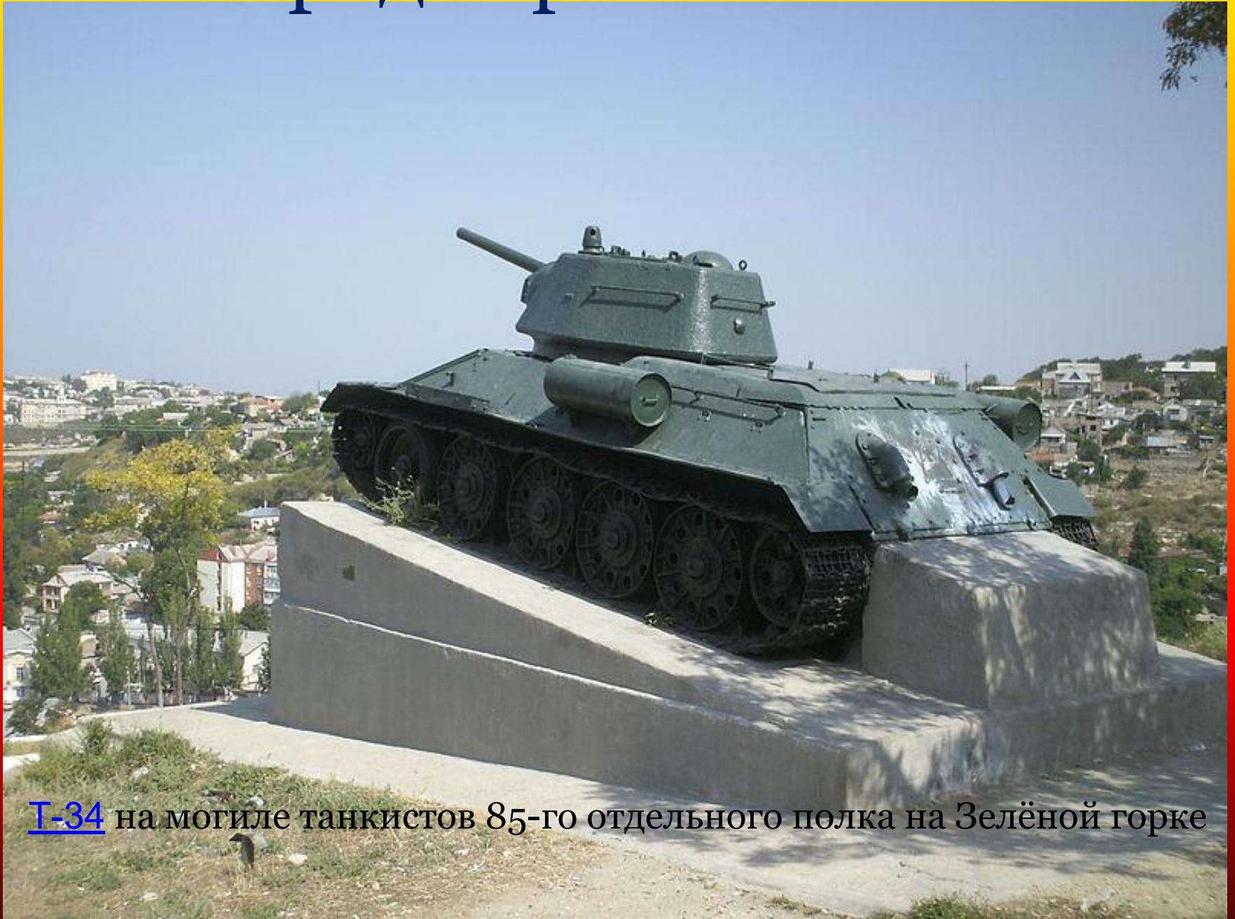
T-34 на могиле танкистов 85-го отдельного полка на Зелёной горке