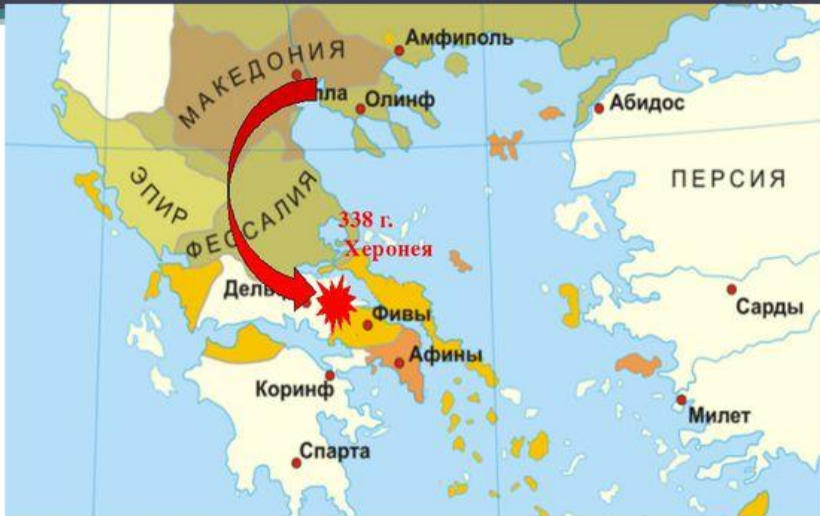
Битва при Херонее