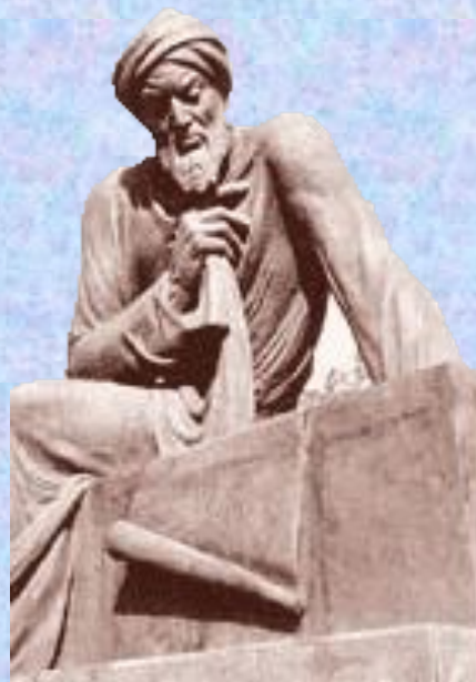
Аль – Хорезм