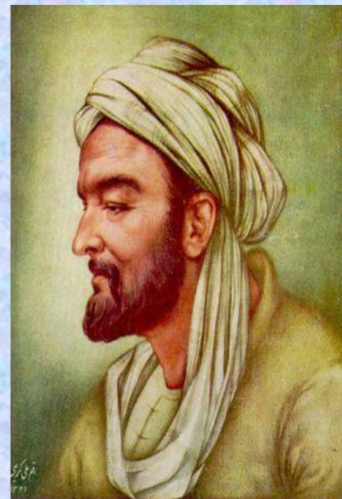
Абу Али ибн Сина.