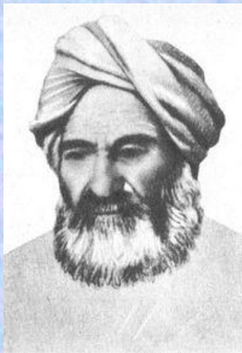
Абу Райхан Бируни,