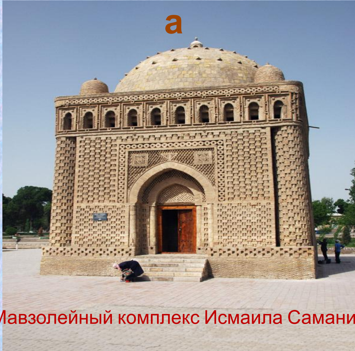
Мавзолейный комплекс Исмаила Самани