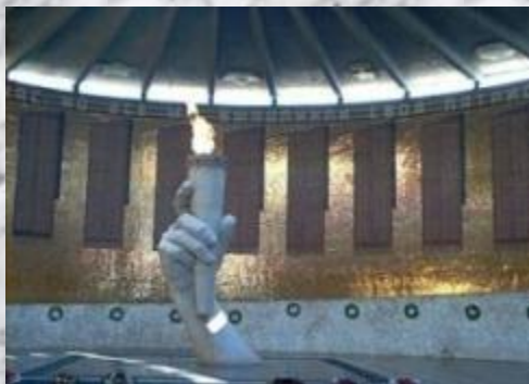
Зал Воинской славы