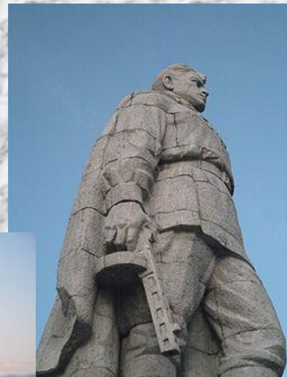
«Алёша». Памятник воину-освободителю в Пловдиве. Болгария