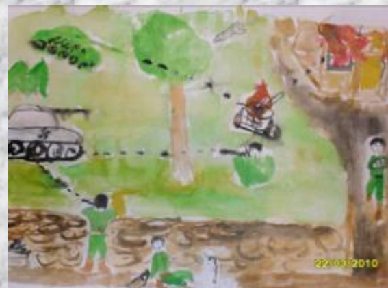
Берг Иван. «Сталинградская битва»