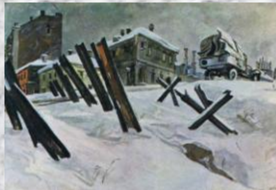
А. Дейнека «Окраина Москвы. Ноябрь 1941 года» (1941)