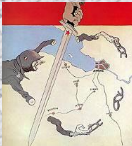
Кукрыниксы. Плакат «Руки короткие»