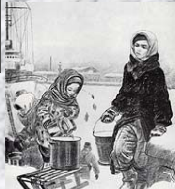
А.Ф. Пахомов из серии «Ленинград в дни блокады.» «За водой».