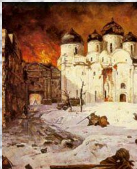
Кукрыниксы. «Бегство фашистов из Новгорода»