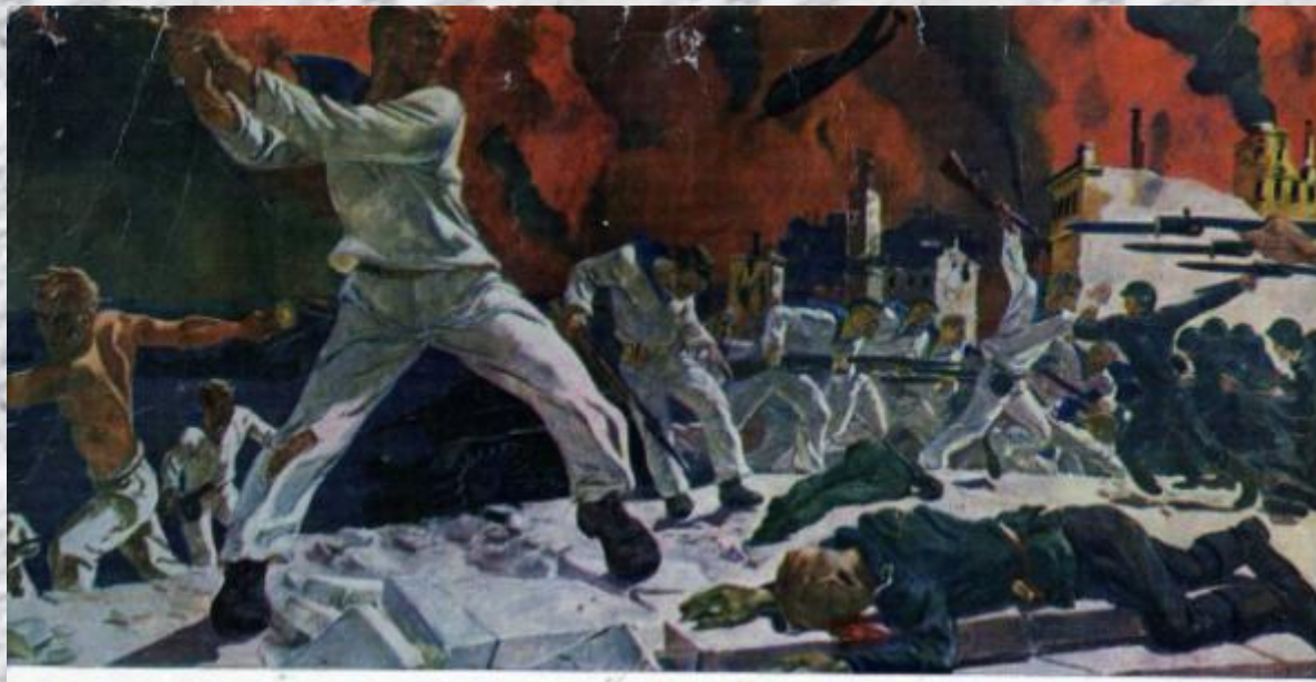
А. А. Дейнека «Оборона Севастополя»