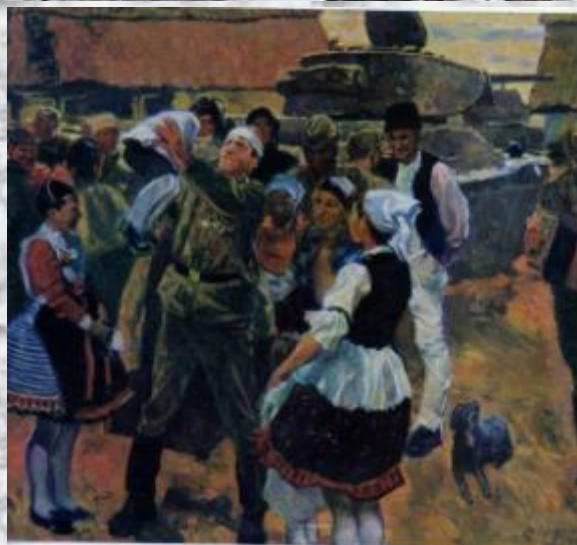
Самсонов М. «В освобожденном селе»