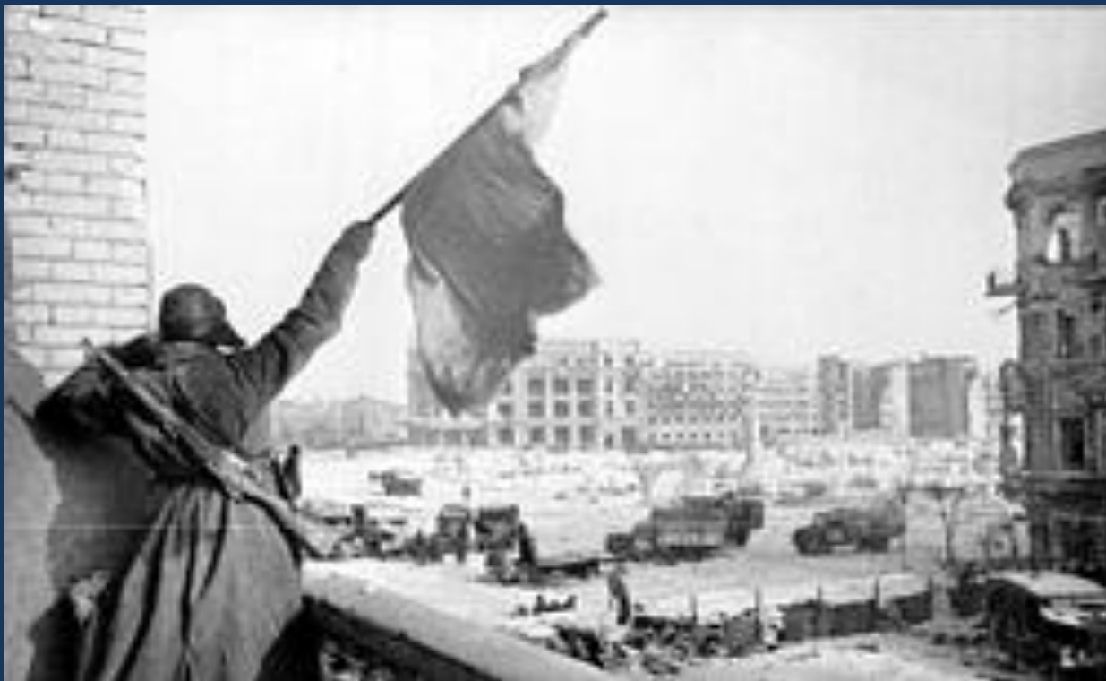
Флаг над освобождённым городом, Сталинград, 1943 года