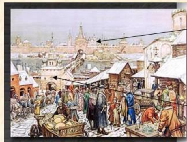
А.М. Васнецов Новгородский торг