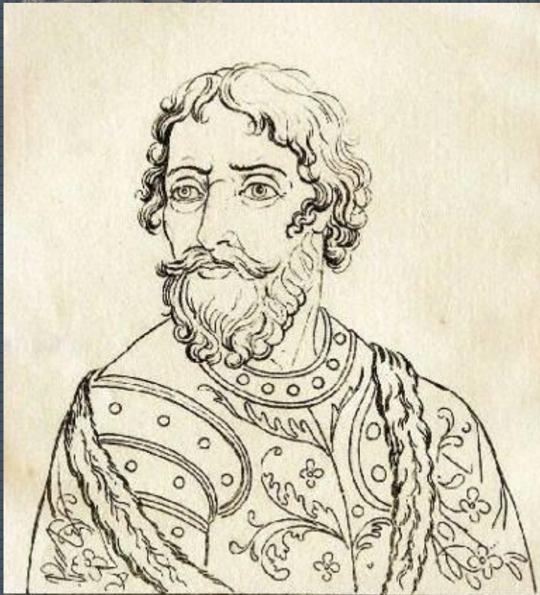
IVAN III, VASSILIÉVITCH.

Тяжкие думы терзали Великого князя Ивана Васильевича. Не новью были для него государственные дела после смерти отца. С 11 лет Иван был «глазами отца». Но тогда был рядом, поддерживал, а теперь Русь на его плечи легла, да грузом нелёгким. Как всю объять взором, ничего не упустить? На решение каких проблем прежде всего направить свои силы?