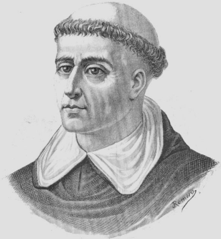
Томас Торквемада – глава испанской инквизиции