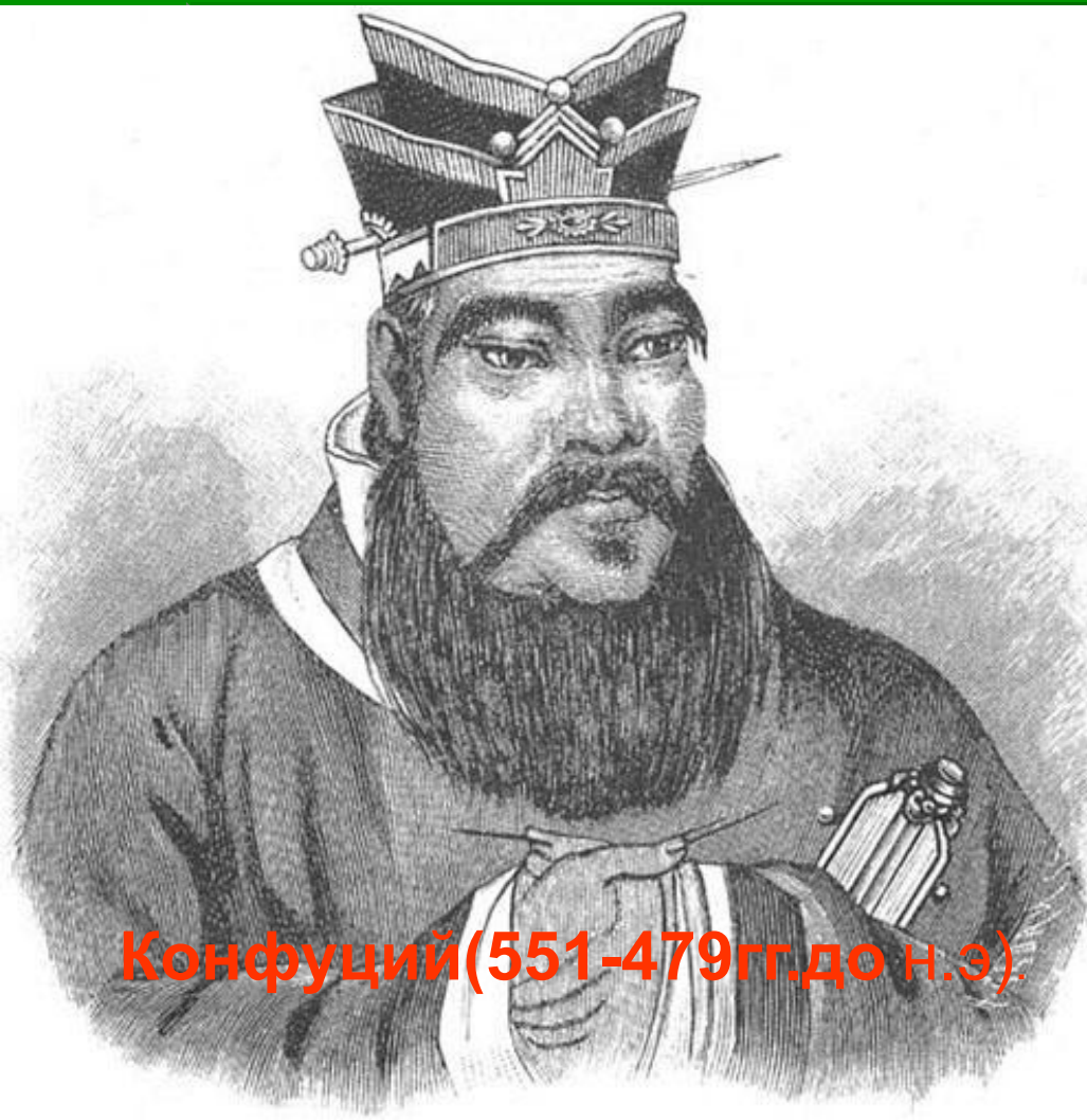
Конфуций (551-479 гг. до н.э.)