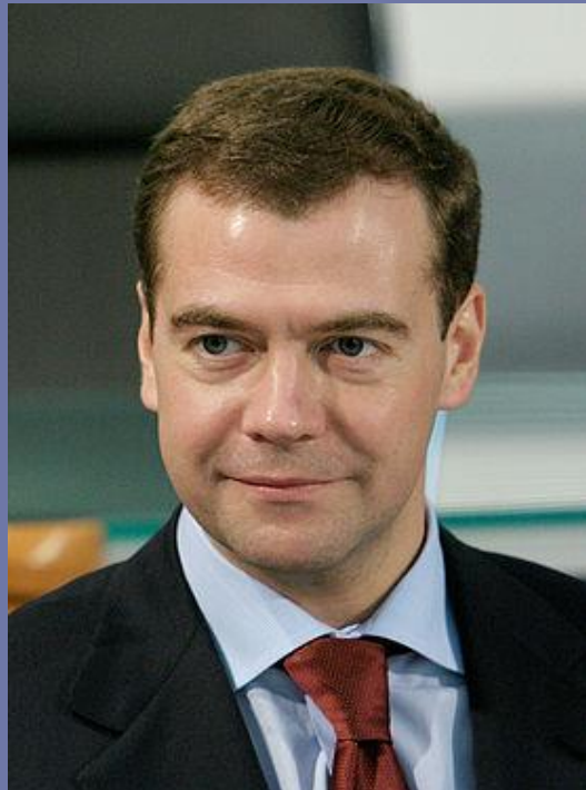
Д. А. Медведев