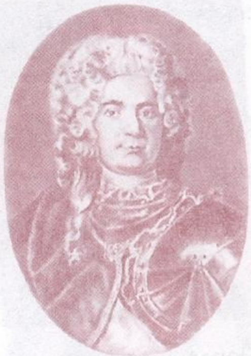
Павел Иванович Ягужинский, генерал-прокурор Сената