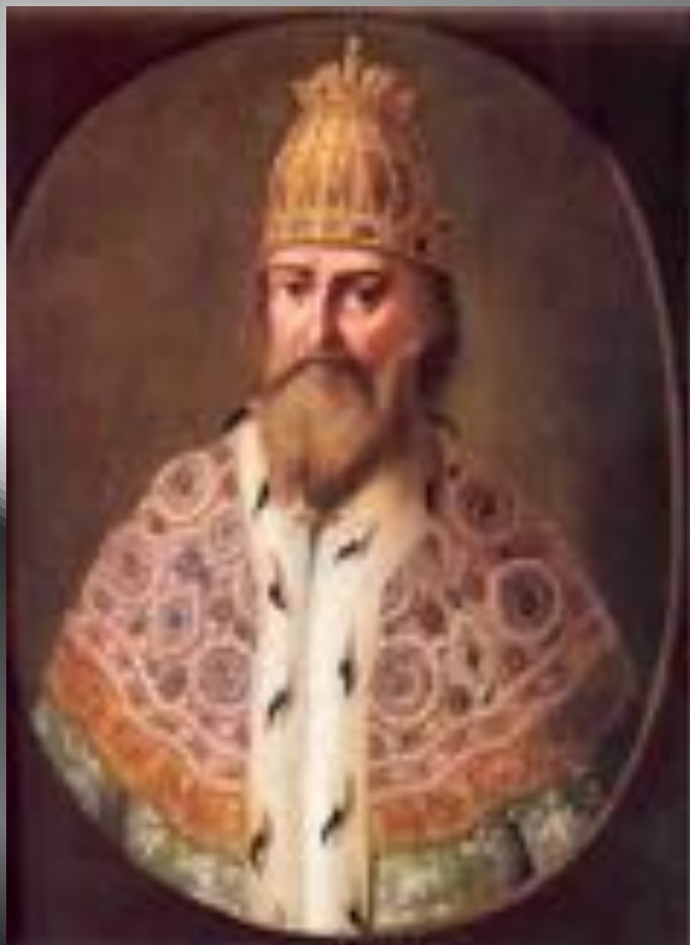
Иван IV Грозный