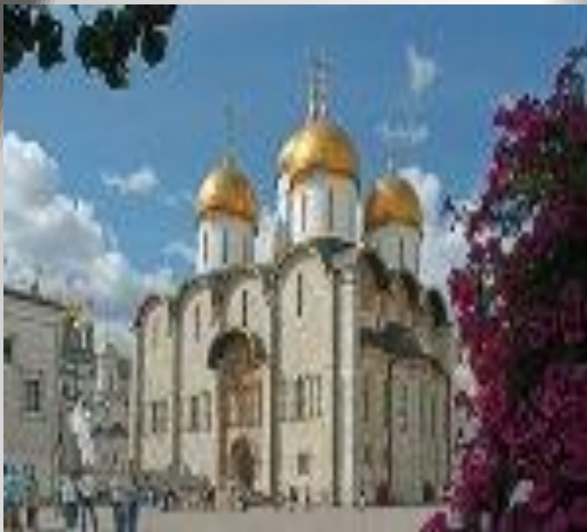
Успенский собор XV в.