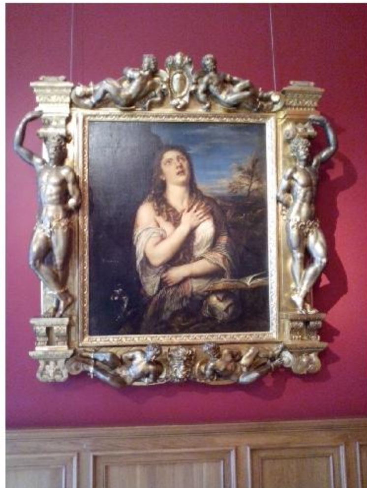
Кающаяся Мария Магдалина