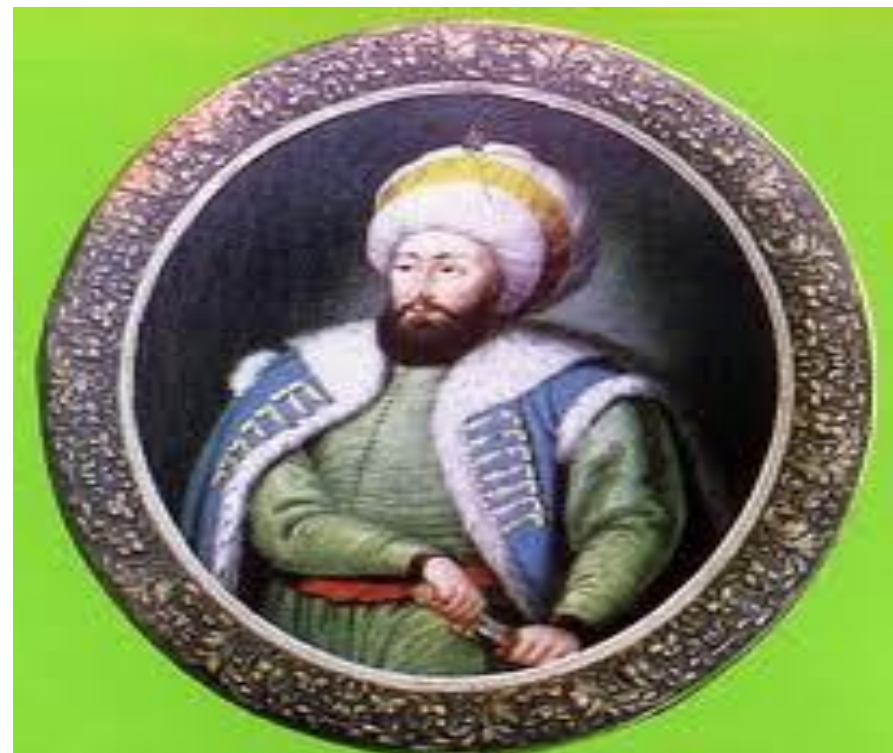
7. Sultan Mehmed II. (Fatih) 1444-1446 / 1451-1481