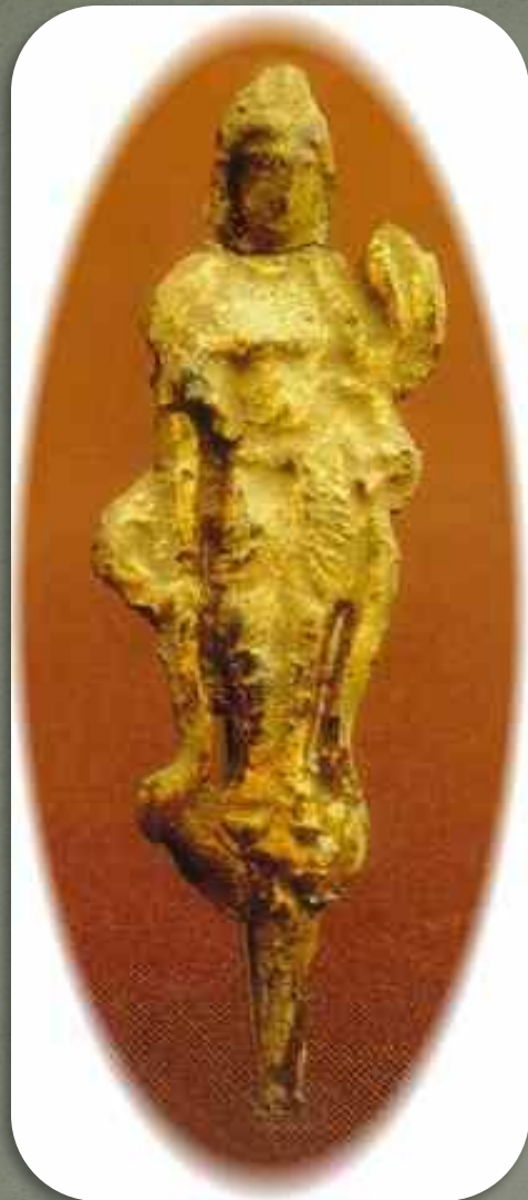
Бронзовая позолоченная фигурка бодисатвы Гуаньинь