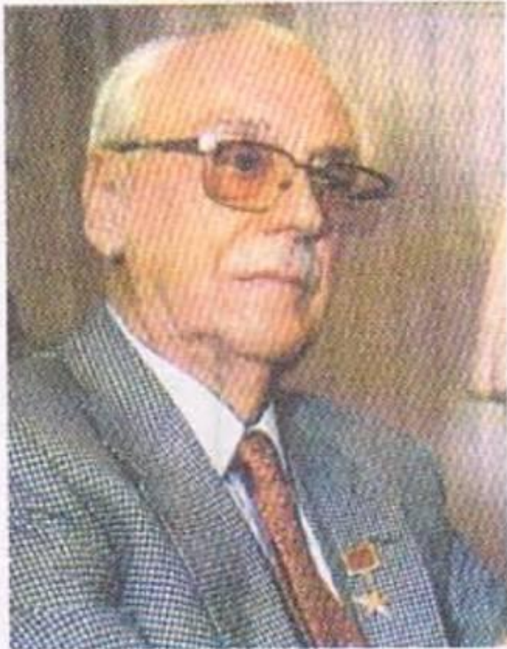
С. В. Михалков