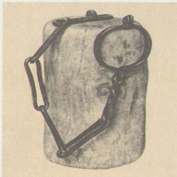
Ручные и ножные кандалы. XVIII в.