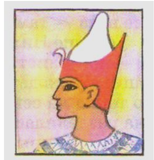
Двойная корона фараона