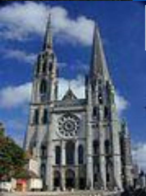
•Собор в Шартрі, Франція

В багатьох містах на базі церковних та приходських шкіл виникали університети, як нові форми культурно-просвітницьких установ. Вони сприяли розвитку освіченості та поступово змінювали мислення середньовічної людини. Посилюється дух раціоналізму, дух допитливості, встановлюється тенденція до дослідження нового. Зростала індивідуалізація світовідчуття кожної особистості. Поступово університети перетворилися на своєрідні інтелектуальні центри. На зміну романському мистецтву прийшла готика. Синонімом варварства назвали історики Відродження середньовічне мистецтво. На відміну від романського, готичне мистецтво «пропагує» інтерес до людських почуттів, звертається до краси реального світу, повертається до індивідуальності. Готичне мистецтво є символом квітучих торговельних і ремісничих міст-комун, що домоглися популярності й самостійності усередині феодального світу. Грандіозні готичні собори вирізнялися висотою, місткістю, ошатністю, видовищним і багатим декором. Для готичного стилю характерні гострі споруди, зі стрілчастими склепіннями, безліч кам'яного різьблення і скульптурних прикрас.