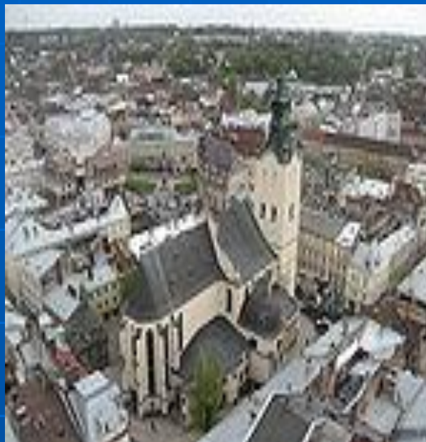
• Львівський кафедральний костел

Об'ємну композицію костелу витворено завдяки двом головним складовим: пресбітеріуму (вівтарній частині) та корпусу нав (власне молитовній залі).