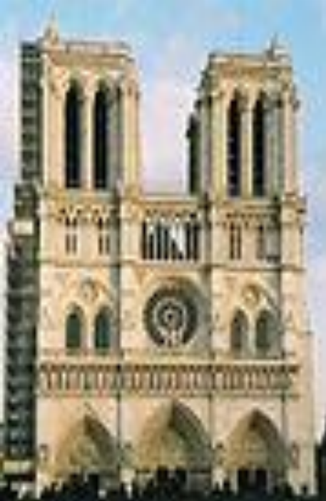
•Собор Паризької Богоматері