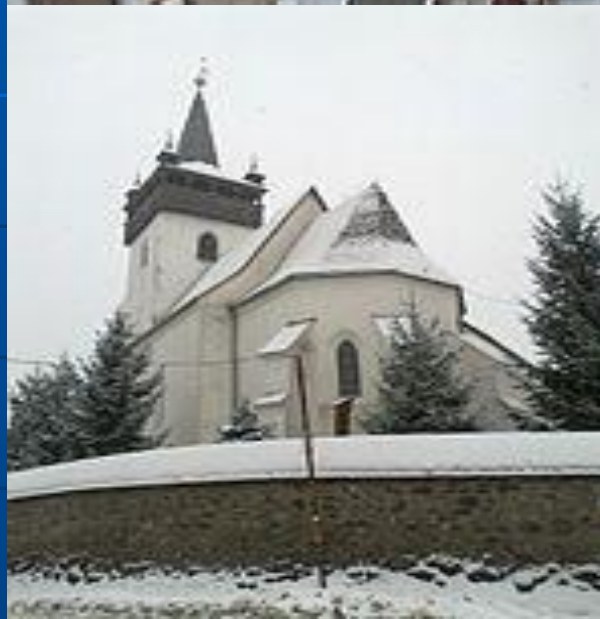
• Церква Святої Єлизавети в Хусті Церква Святої Єлизавети в Хусті на Закарпатті - одна з найхарактерніших пам'яток готики на українських теренах, нині Хустська Реформатська церква