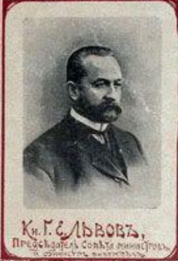
К. Г. С. ЛЬВОВЪ, Председатель Совета министровъ и директоръ путей сообщения.