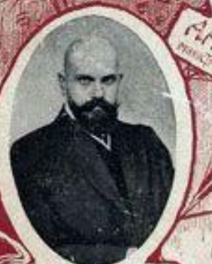
В. М. ЛЬВОВЪ, оберъ-прокуроръ Св. Синода.