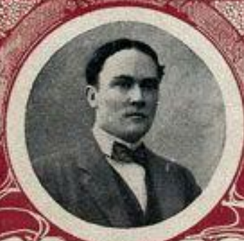
М. В. ТЕРЕШЕНКО, министръ финансовъ.