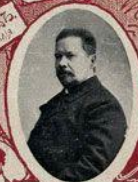
В. В. ГОДЕВЪ, Госуд. советникъ, контролеръ.