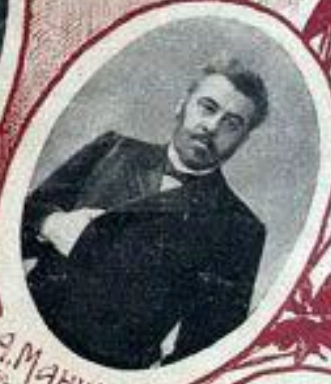
А. А. МАНУИЛОВЪ, министръ финансовъ.