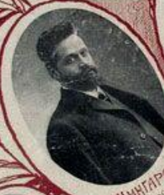
А. М. ШИНГАРЕВЪ, министръ земледѣлiя.