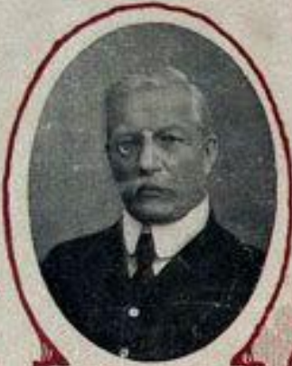
П. Н. МИЛЮКОВЪ, министръ иностранныхъ дѣлъ.