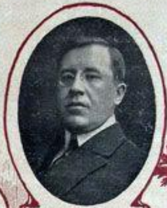
А. И. КОНОВАЛОВЪ, министръ торговли и промышленности.