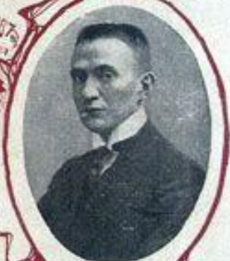
А. Ф. КЕРЕНСКИЙ, министръ юстици.