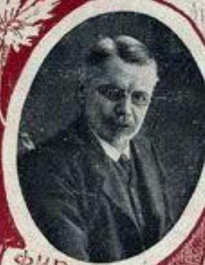
Ф. И. РОДИЧЕВЪ, министръ путей сообщения.