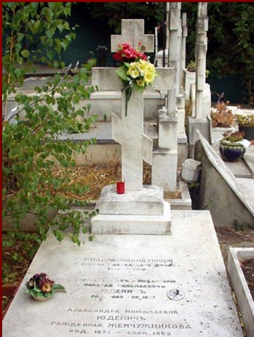
Семейная могила Юденича в Ницце