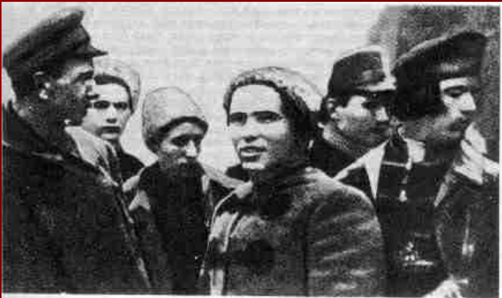
Нестор Махно зі своїм штабом