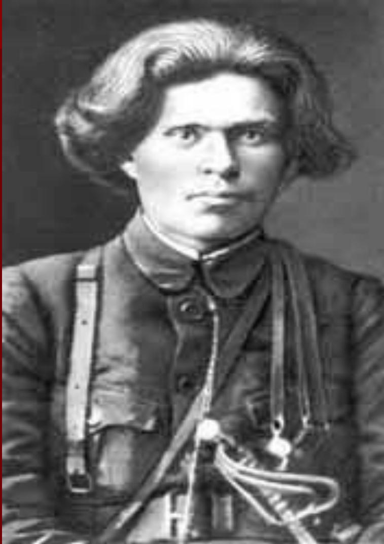
Махно Нестор Иванович – руководитель анархо- крестьянского движения