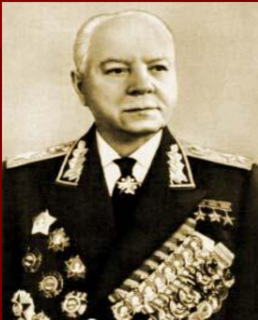
Ворошилов Климент Ефремович – маршал Советского Союза