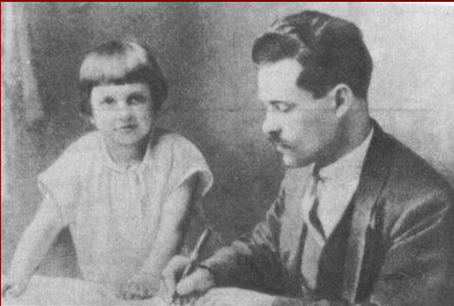
Махно с дочерью Ольгой в эмиграции