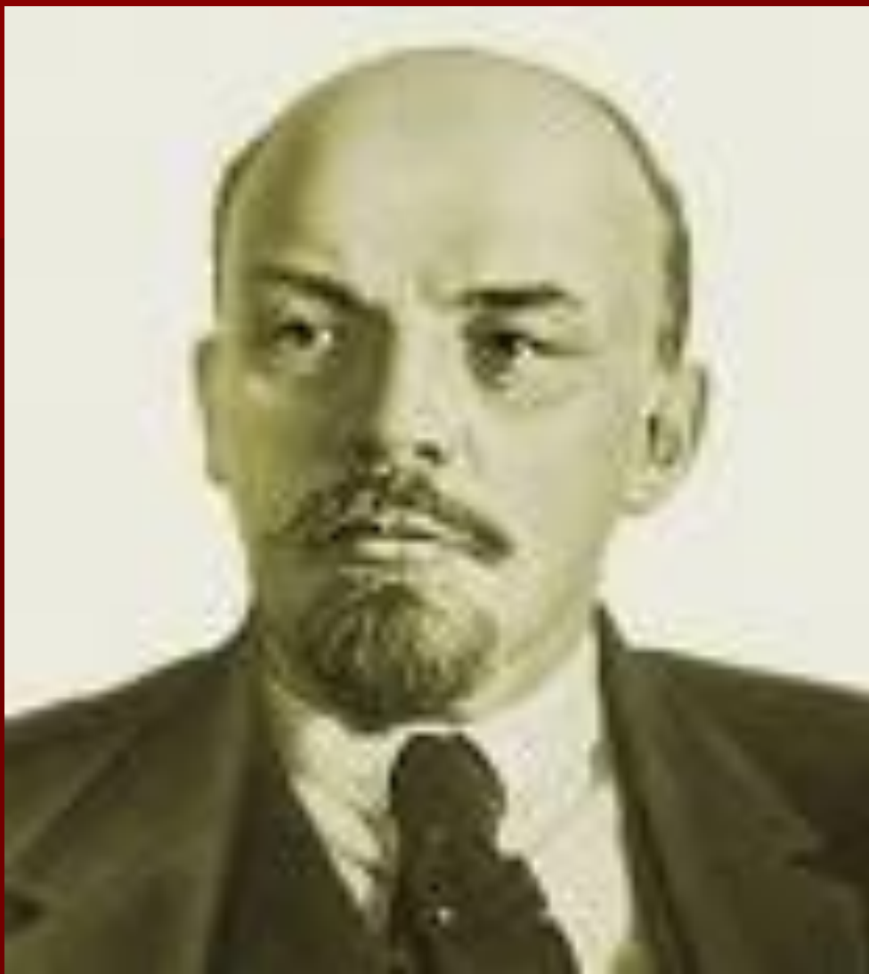
Владимир Ильич Ленин – вождь революции