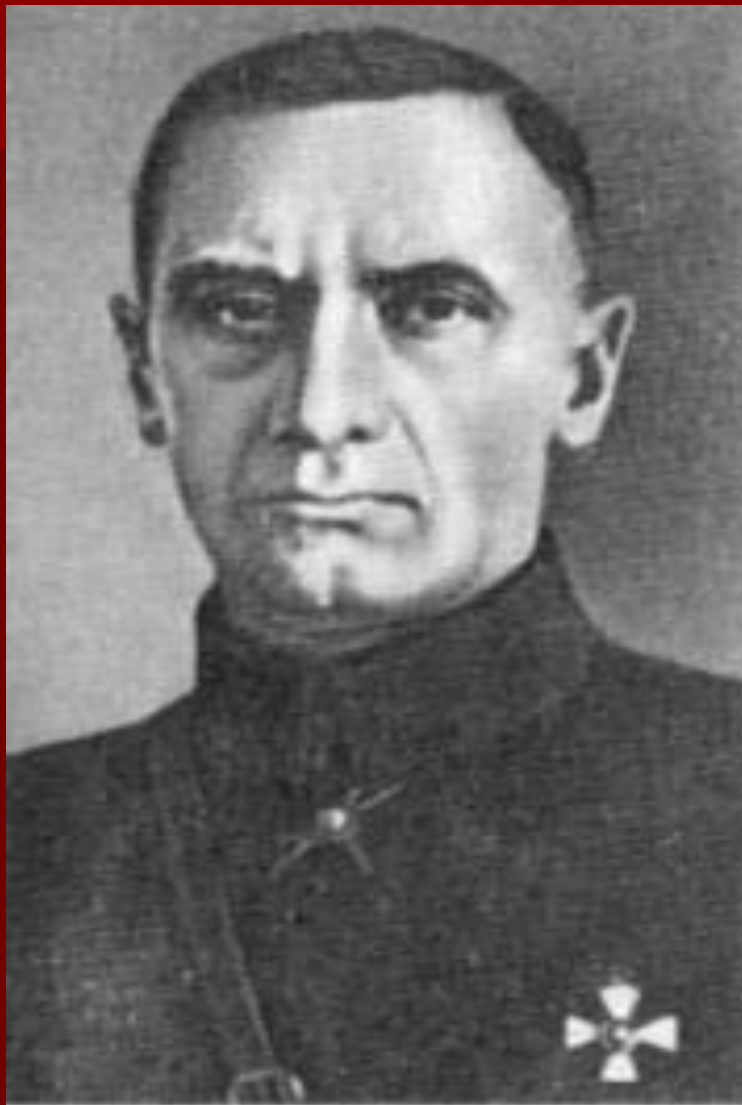
Колчак Александр Васильевич – российский военачальник, адмирал