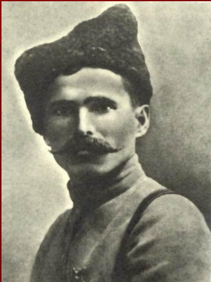
Чапаев Василий Иванович – командующий 25-й стрелковой дивизией