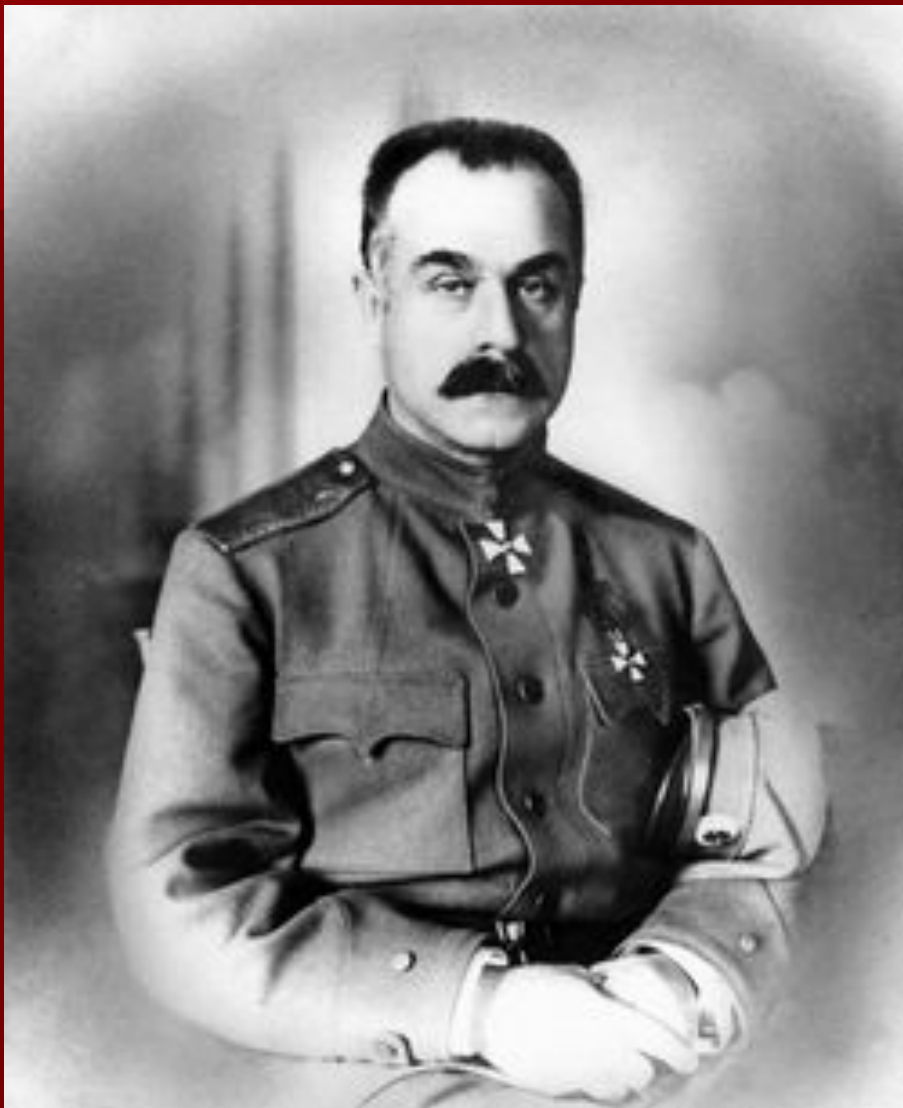
Каледин Алексей Максимович — один из главных руководителей белоказачьего движения