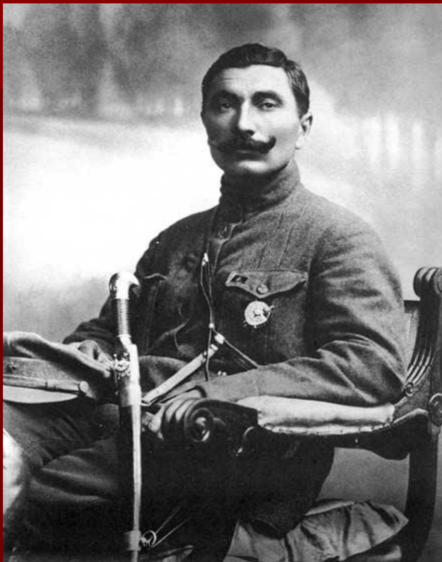
Будённый Семён Михайлович – командующий Первой конной армией, маршал Советского Союза