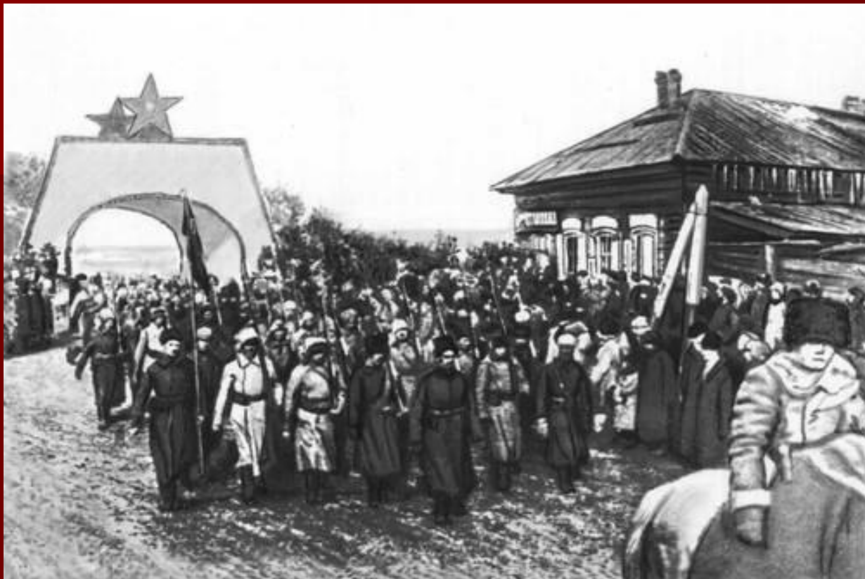
Вступление в Иркутск 5-й армии. 1920 г.