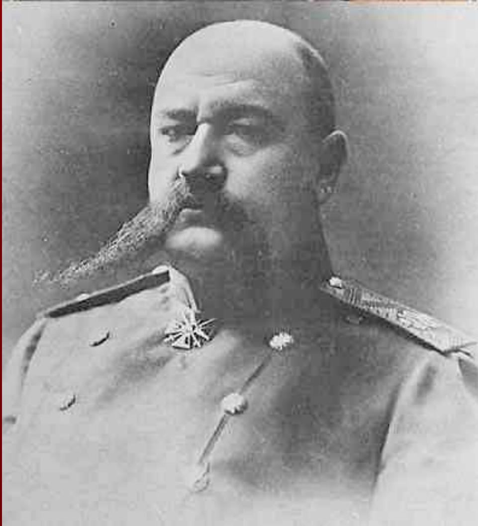
Юденич Николай Николаевич- военачальник, генерал от инфантерии