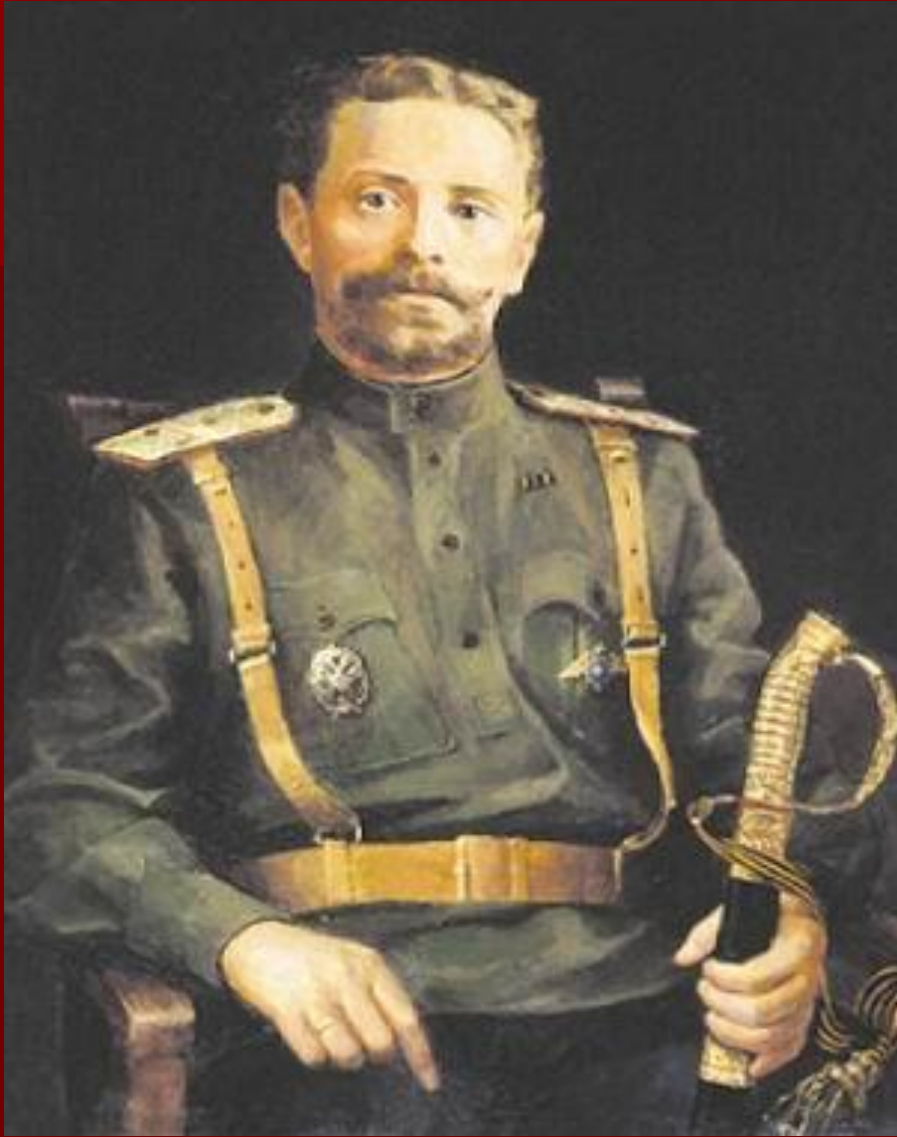
Каппель Владимир Оскарович – генерал-лейтенант, с 1919 г. командовал колчаковским Восточным фронтом