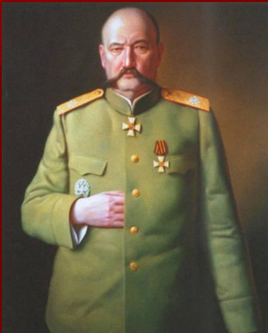
Юденич в эмиграции