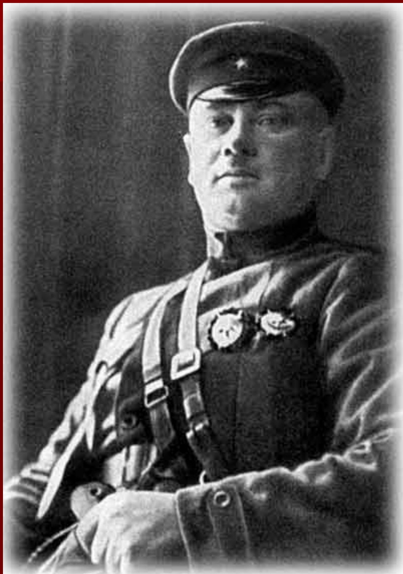
Котовский Григорий Иванович – командир кавалерийской бригады, дивизии, корпуса