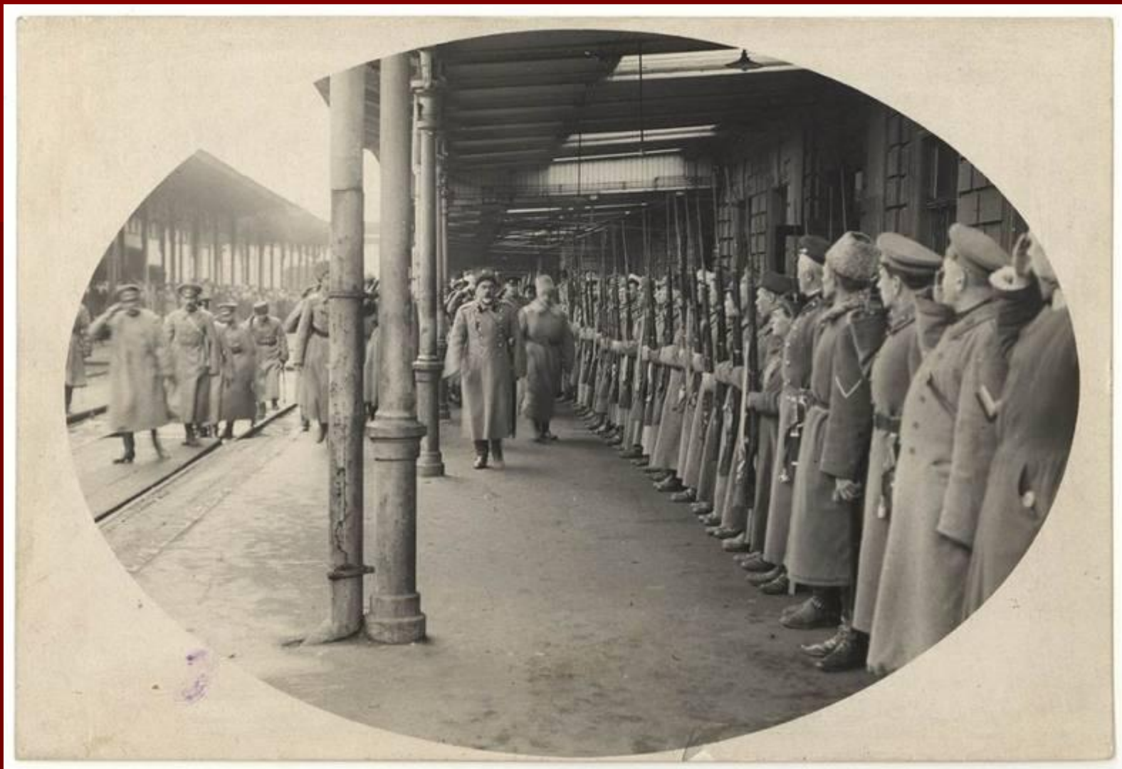
Деникин на вокзале в Ростове