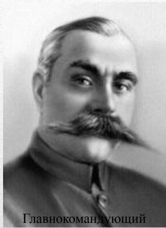
Главкомандующий вооружёнными силами Республики (1919—1924)