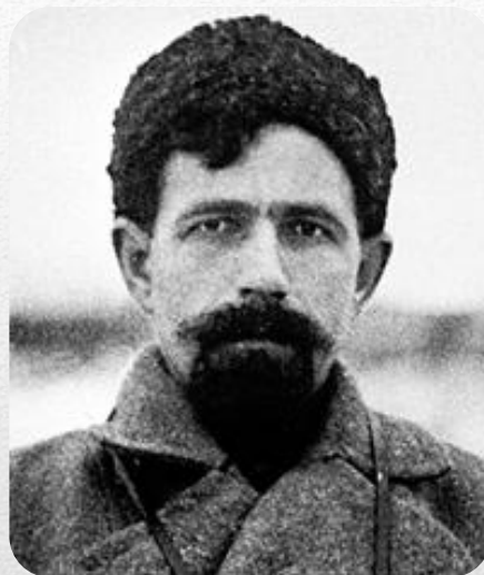
Один из создателей Красного флота П. Е. Дыбенко