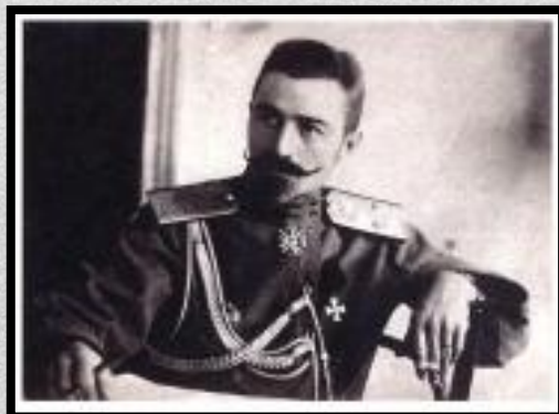
Один из вождей Белого Движения Генерального штаба генерал-лейтенант С. Л. Марков