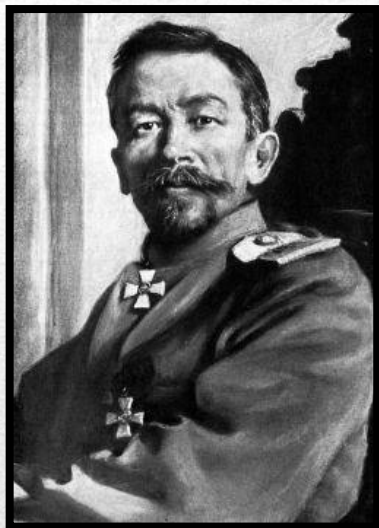
Лидер Белого движения на Юге России Генеральный штаба генерал от инфантерии Л. Г. Корнилов