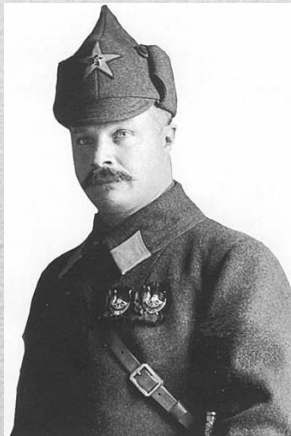
М. В. Фрунзе