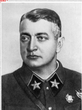
М. Н. Тухачевский