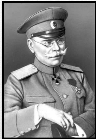
Создатель и Верховный руководитель Добровольческой армии Генерального штаба генерал-адъютант М. В. Алексеев