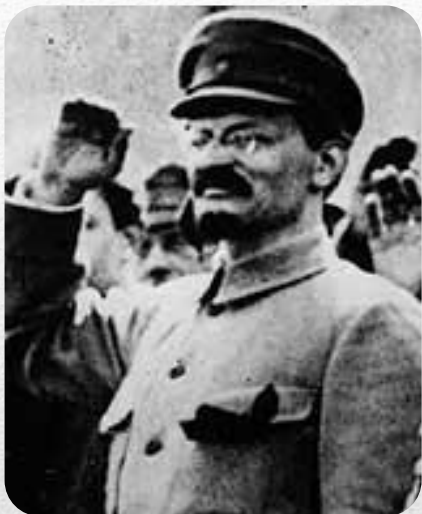
Один из создателей Красной армии Л. Д. Троцкий, 1917