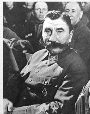
С. М. Будённый