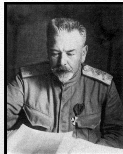
Один из организаторов Добровольческой армии Генерального штаба генерал-лейтенант А. С. Лукомский