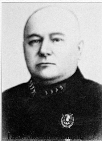
вооружёнными силами Республики (01.09.1918—09.07.1919)