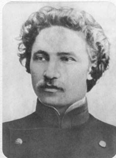
Один из создателей Красной армии Н. И. Подвойский