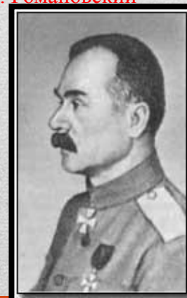
Генерал от кавалерии, Атаман Войска Донского А. М. Каледин