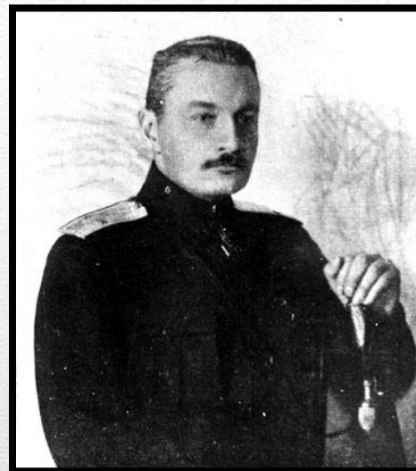
Один из организаторов Добровольческой армии Генерального штаба генерал-лейтенант И. П. Романовский