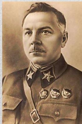
К. Е. Ворошилов