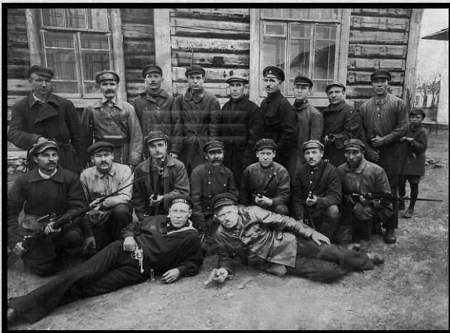
Участники Красной гвардии 1917—1918 гг.

Поначалу в большинстве районов страны установление большевистской власти шло быстро и мирным путём: из 84 губернских и других крупных городов только в пятнадцати Советская власть установилась в результате вооружённой борьбы. Это дало повод большевикам говорить о «триумфальном шествии Советской власти» в период с октября 1917 по февраль 1918 года.