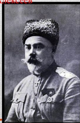
Генерального штаба генерал-лейтенант А. И. Деникин