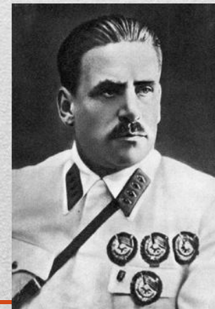
В. К. Блюхер