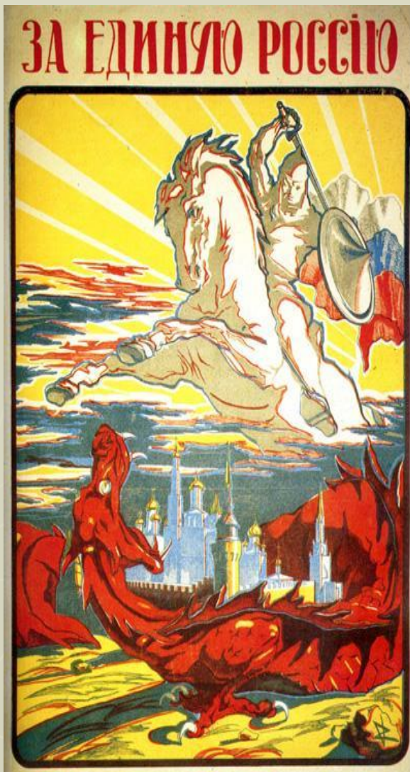
Помните, дорогие братья, какъ въ БОРЬБѢ СЪ БОЛЬШЕВИЗМЪМЪ сердце Россіи, какъ и нынѣ, не въ силахъ вырваться изъ рукъ. Но въ эту минуту, когда въ глазахъ восстающихъ олицъ возмужавъ негодникъ, доблестно поспѣлъ на себя поднять смятенія Россіи. Мыслью, ослепленъ рука подвиза и въ бесчеловѣчьи протѣхъ чувствуютъ злѣй, что тверда эта рука, върять се ударъ и въ хлѣбный еку караванной деслады.