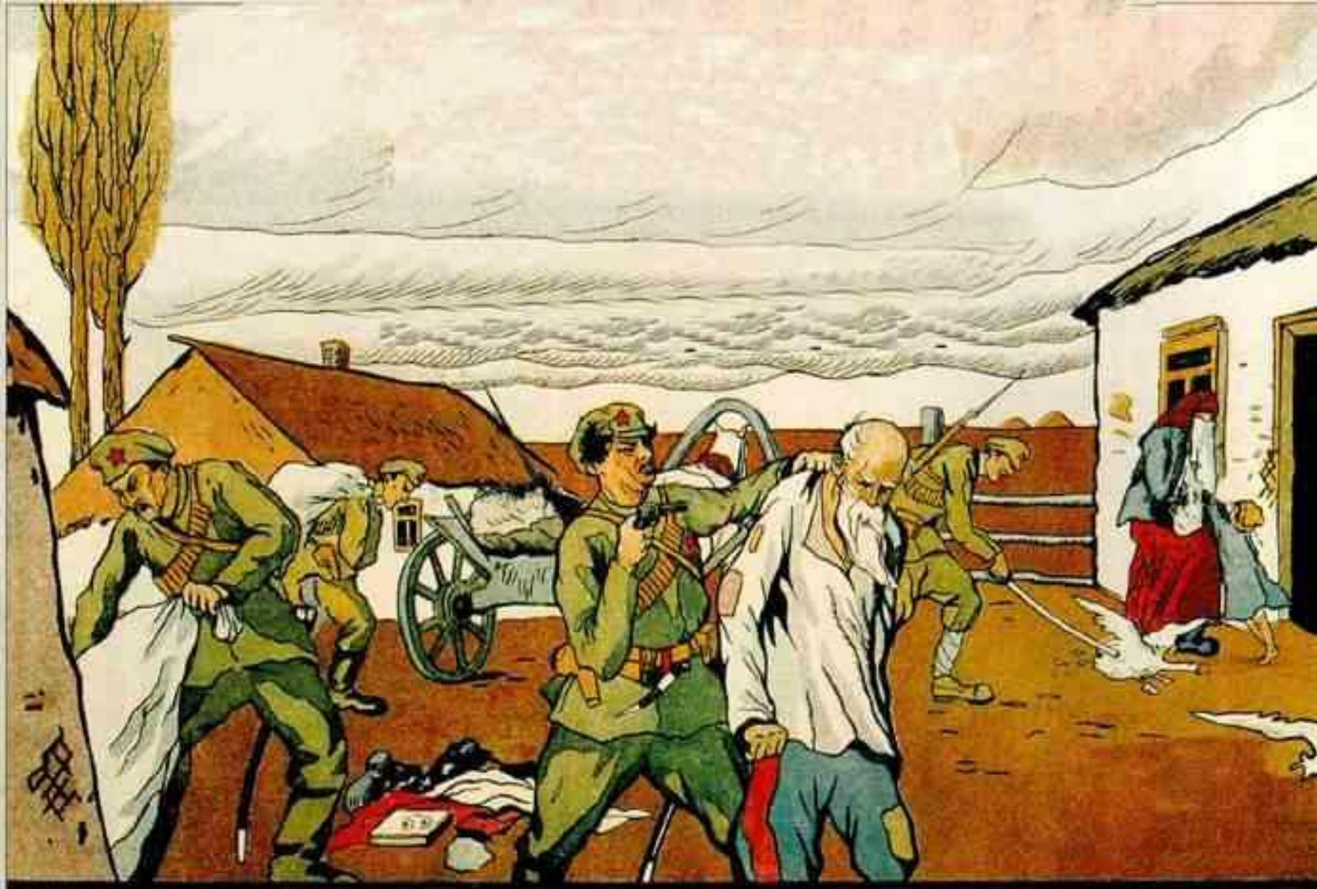
ТАКЪ ХОЗЯЙНИЧАЮТЪ БОЛЬШЕВИКИ ВЪ КАЗАЧЬИХЪ СТАНИЦАХЪ.