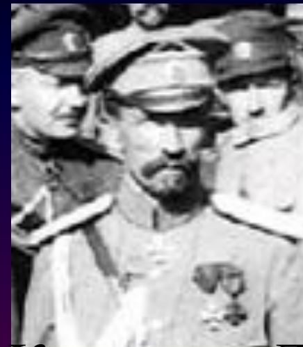
Корнилов Л. Г.