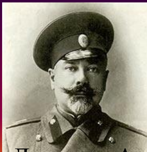
Деникин А. И.