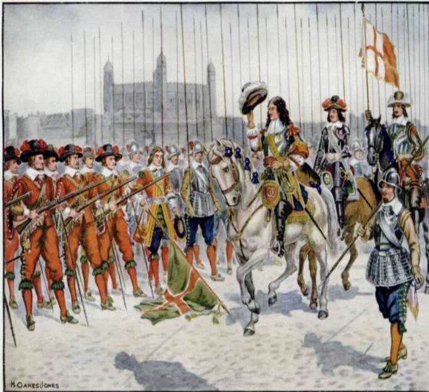
THE "COLDSTREAMERS" (MONK'S REGIMENT) 1644.