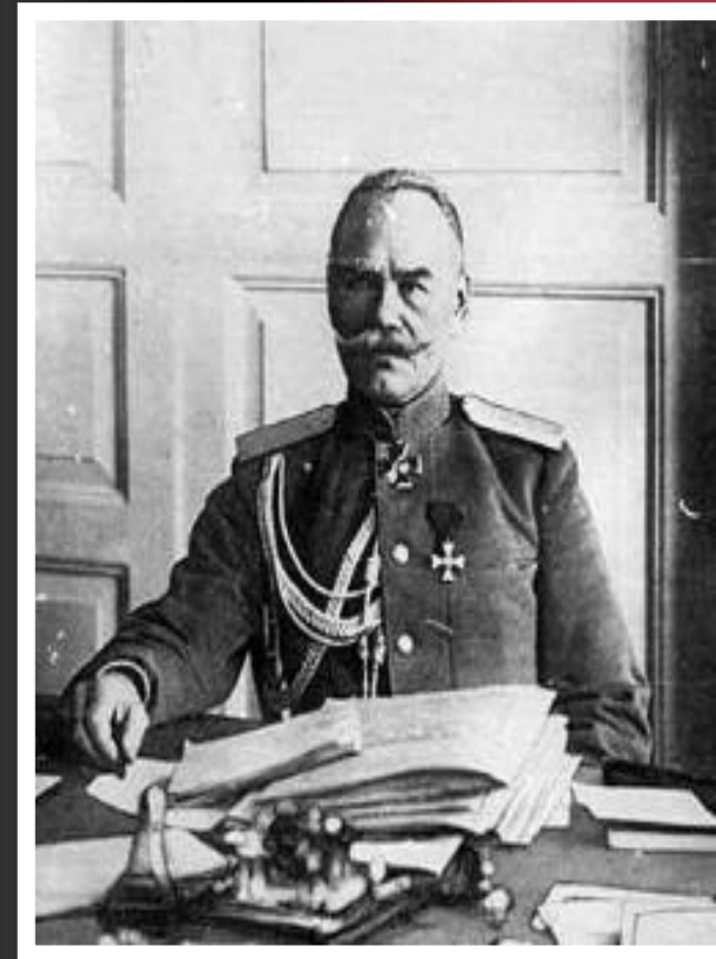
Верховный руководитель Добровольческой армии А.В.Алексеев

Дальний Восток: высадка американских и японских войск.