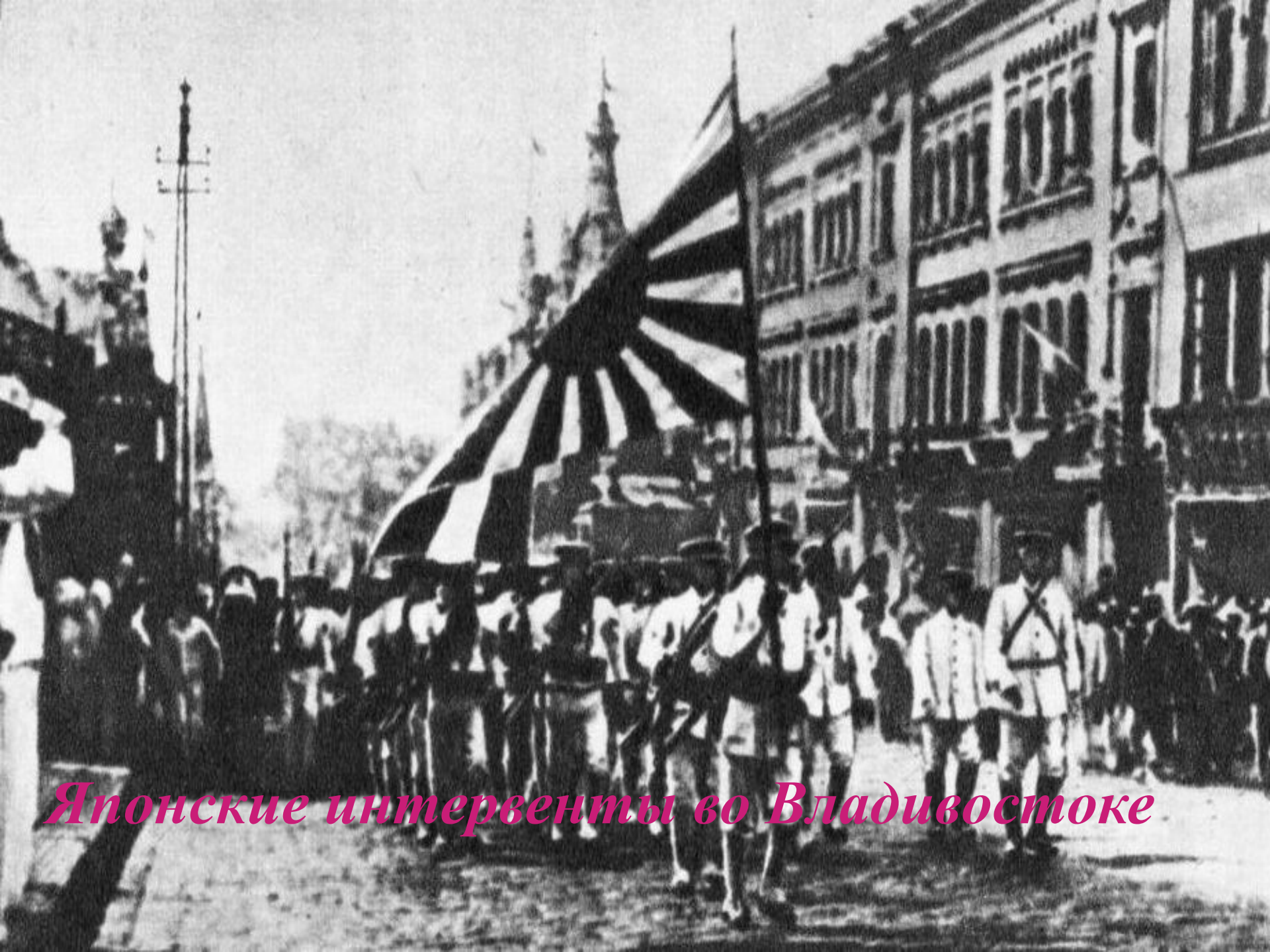
Японские интервенты во Владивостоке