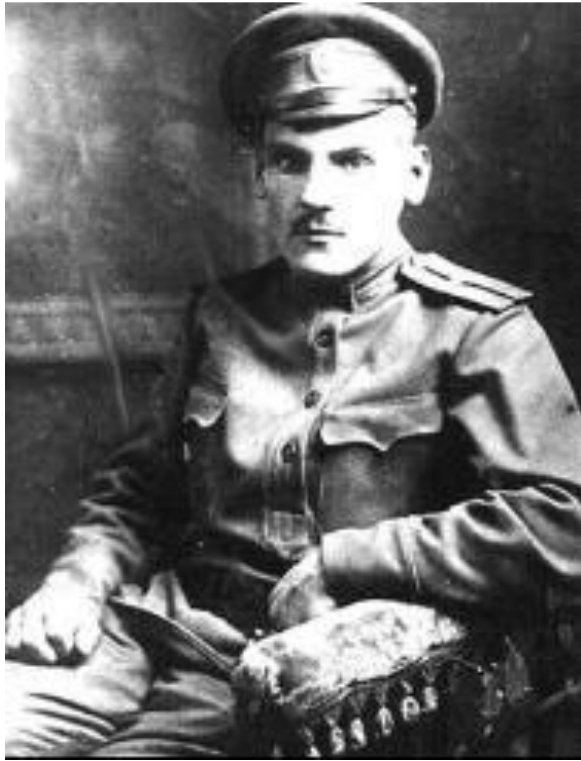
Народный комиссар по военным делам Н.Крыленко.