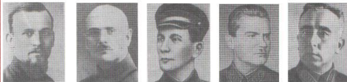
Э.П.Берзинь. Ф.К.Калнинь. И.Я.Строд. Р.П.Эйдеман. Я.Я.Лацис.