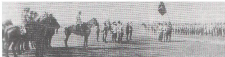
Вручение Красного знамени ВЦИК Латвийской стрелковой дивизии за участие в разгроме армии Деникина. Берислав, 2 августа 1920 года.