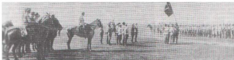
Вручение Красного знамени ВЦИК Латвийской стрелковой дивизии за участие в разгроме армии Деникина. Берислав, 2 августа 1920 года.