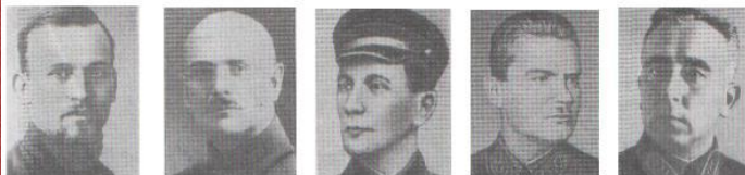
Э.П.Берзинь. Ф.К.Калнинь. И.Я.Строд. Р.П.Эйдеман. Я.Я.Ладиг.