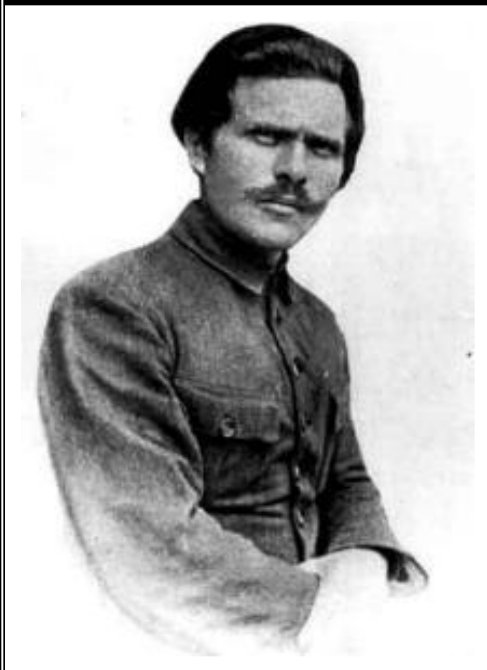
Нестор Махно (1888 -1934 г.г.)

Украина – отряды «батьки Махно» Н.И. Махно – в юности увлёкся идеями анархизма, после революции в Гуляй-Поле (Украина) крестьяне под его руководством провели «чёрный передел» земли. После оккупации Украины германскими войсками возглавил партизанскую борьбу за независимую Украину. Они сражались под чёрными знамёнами с надписями «Свобода или смерть!» Против белогвардейцев махновцы выступали вместе с Красной армией. Но сперва в июне 1919 г., а затем в 1920г. командование Красной армии ведёт борьбу с махновщиной.