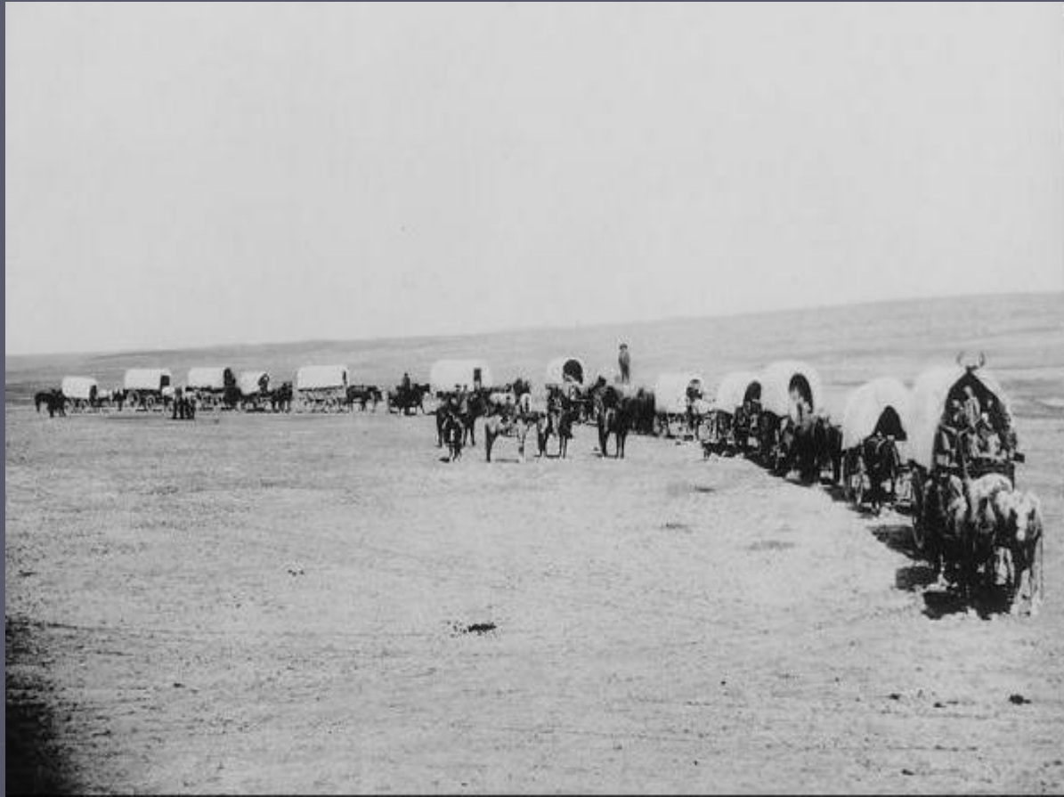
Переселенцы на Запад