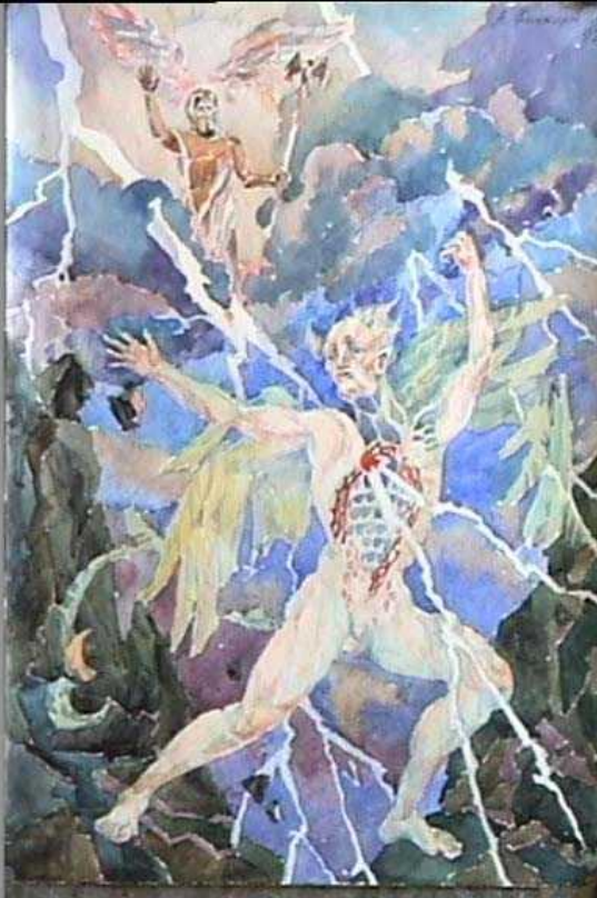
Зевс поражает титана акварель, 1992

Титаны являлись предшественниками олимпийских богов и в этом они сходны с етунами- хримтурсами (скандинавская мифология) и асурами (индийская мифология)