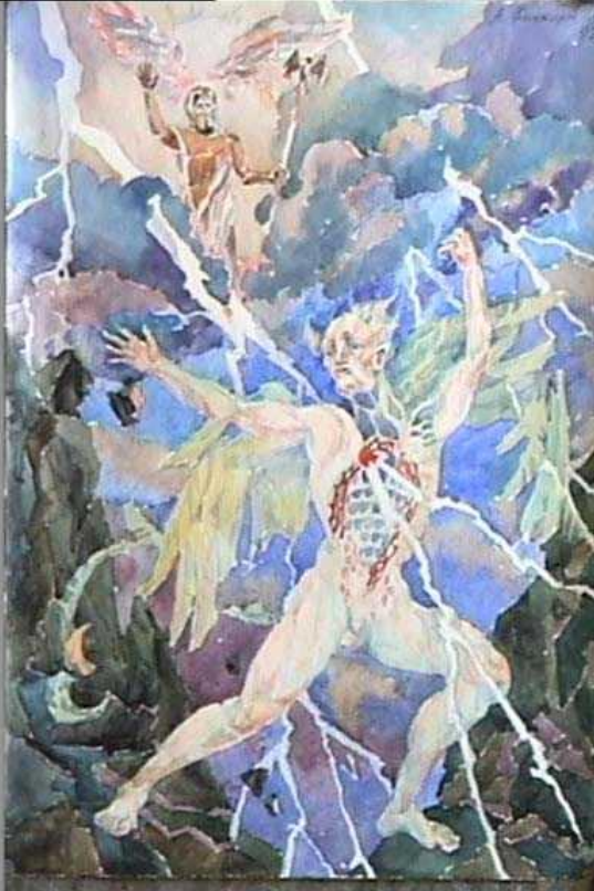
Зевс поражает титана акварель, 1992

Титаны являлись предшественниками олимпийских богов и в этом они сходны с етунами- хримтурсами (скандинавская мифология) и асурами (индийская мифология)