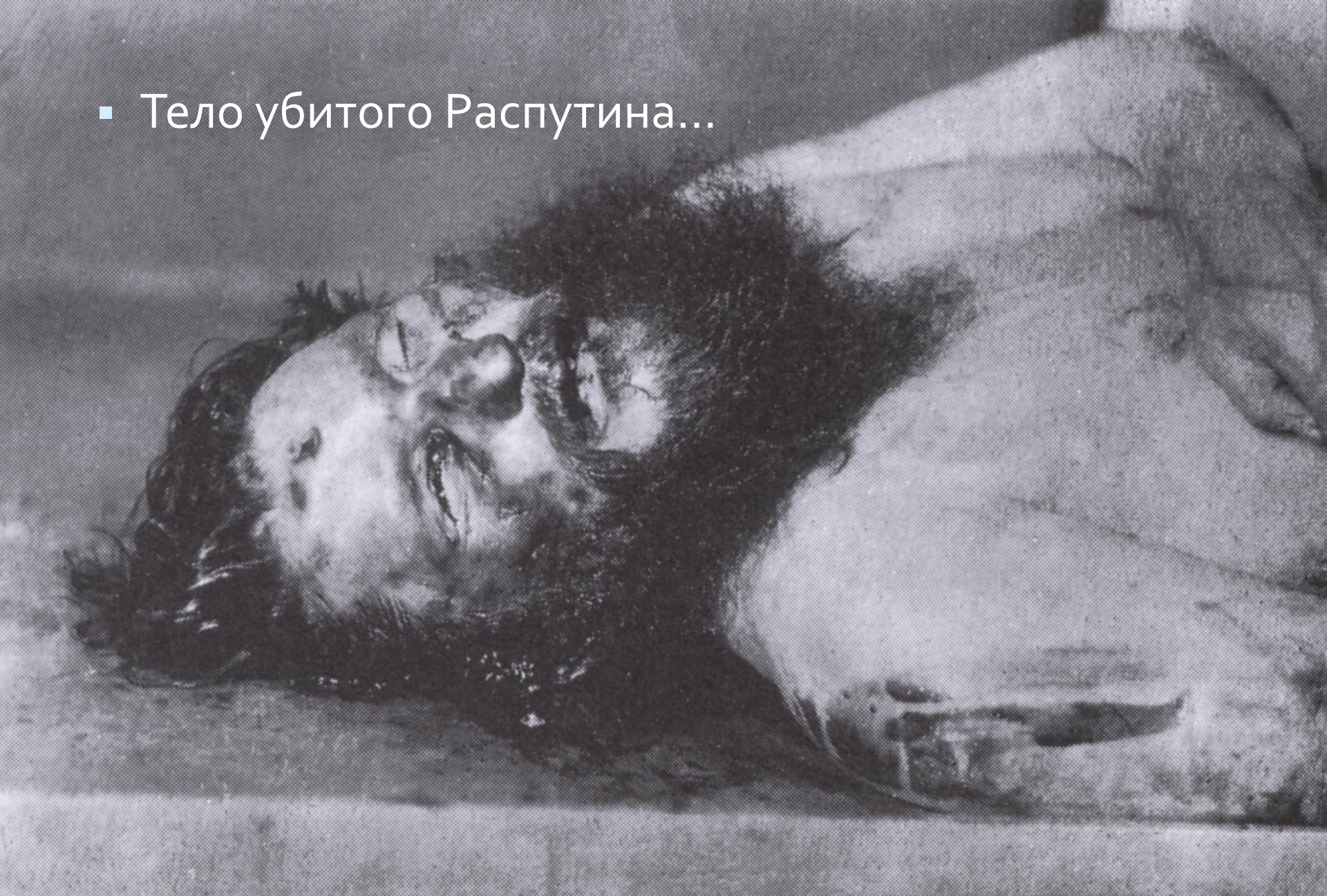
Тело Г. Е. Распутина, убитого в ночь с 16 на 17 декабря 1916 г.